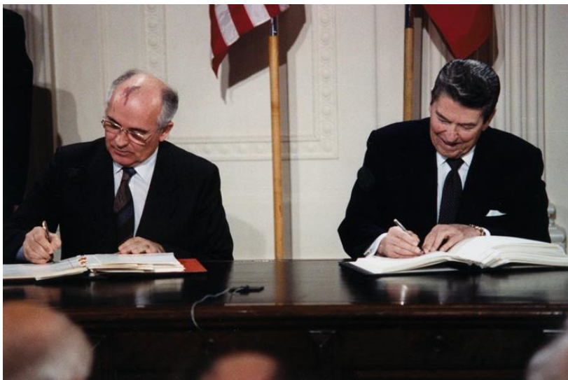
М. Горбачев и Р. Рейган подписывают Договор РСМД

Впервые от переговоров об ограничении вооружений две сверхдержавы перешли к ликвидации этого оружия