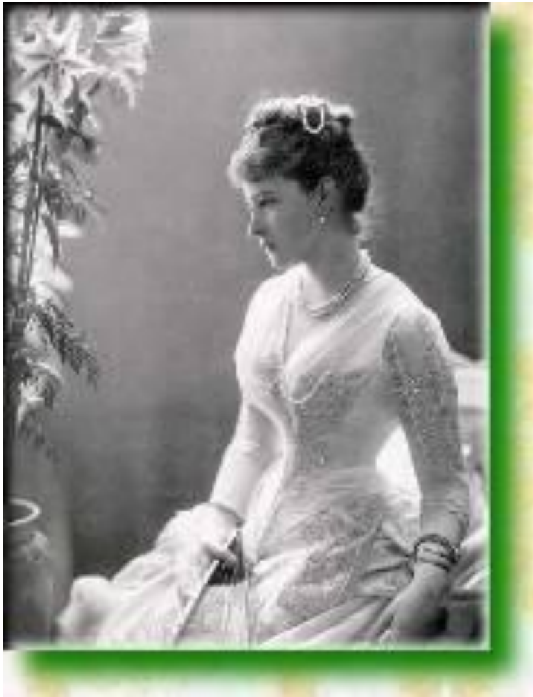
Великая Княжна Елизавета Фёдоровна, основательница Марфо- Мариинской обители в Москве.