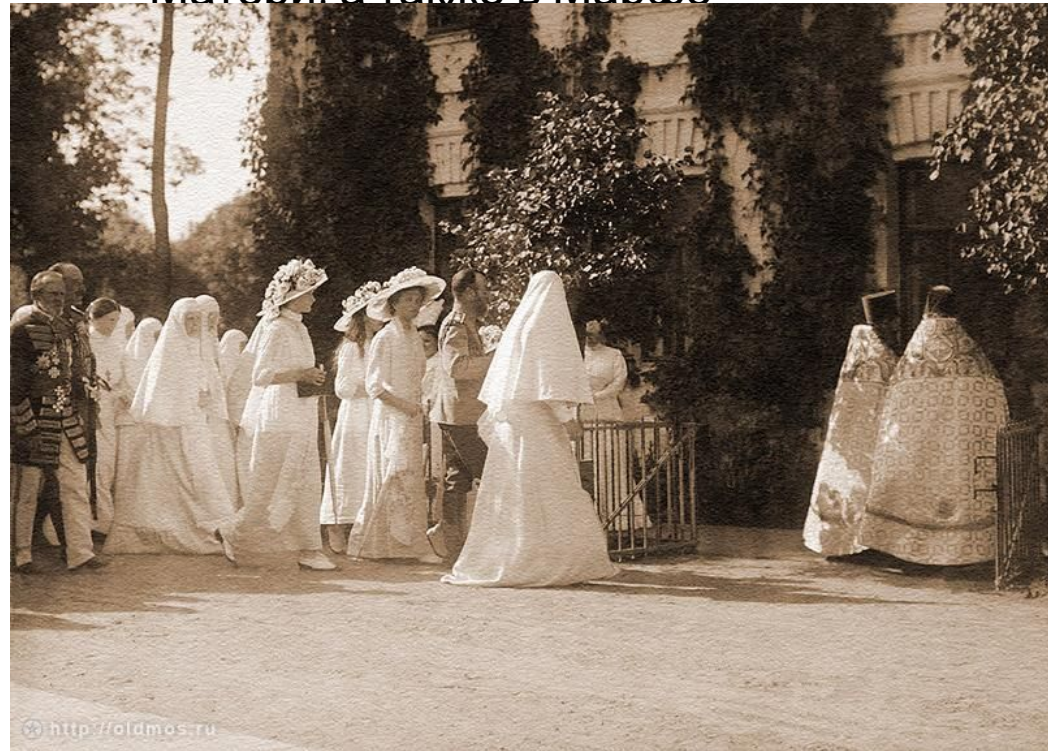
Марфо-Мариинская обитель в Москве.