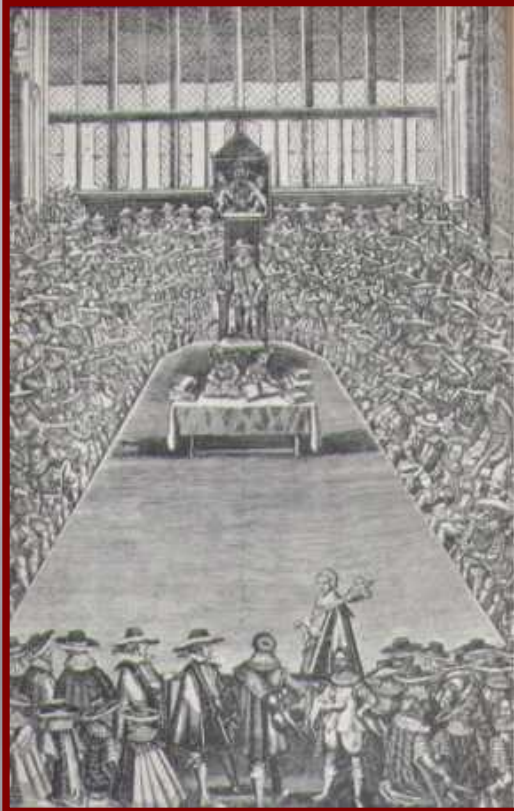
Английский парламента 17 в.

Парламент, в котором большинство составляли пуритане, принял важные реформы: - распустил королевские суды; - запретил епископскую цензуру и полицию; - палата общин могла быть распущена только с ее согласия; - налоги устанавливал парламент; - парламент должен был собираться не реже одного раза в три года и т.д.