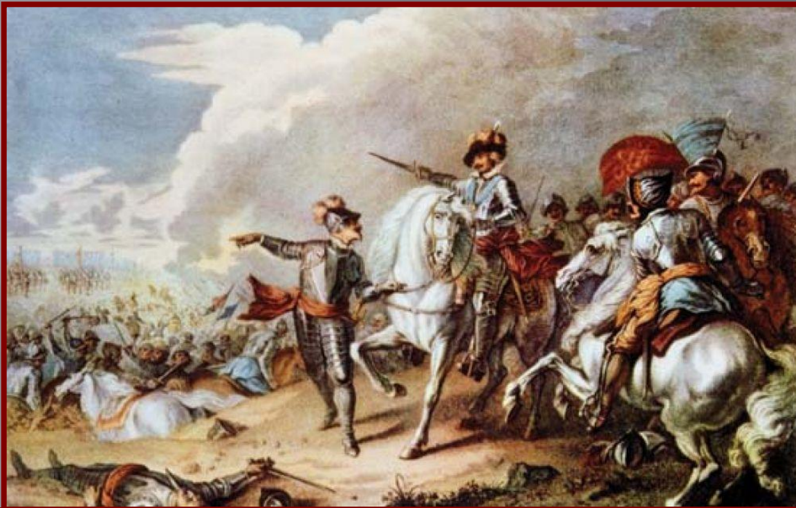
Битва при Нейсби

В июне 1645 г. армия парламента нанесла поражение армии короля в битве при Нейсби.