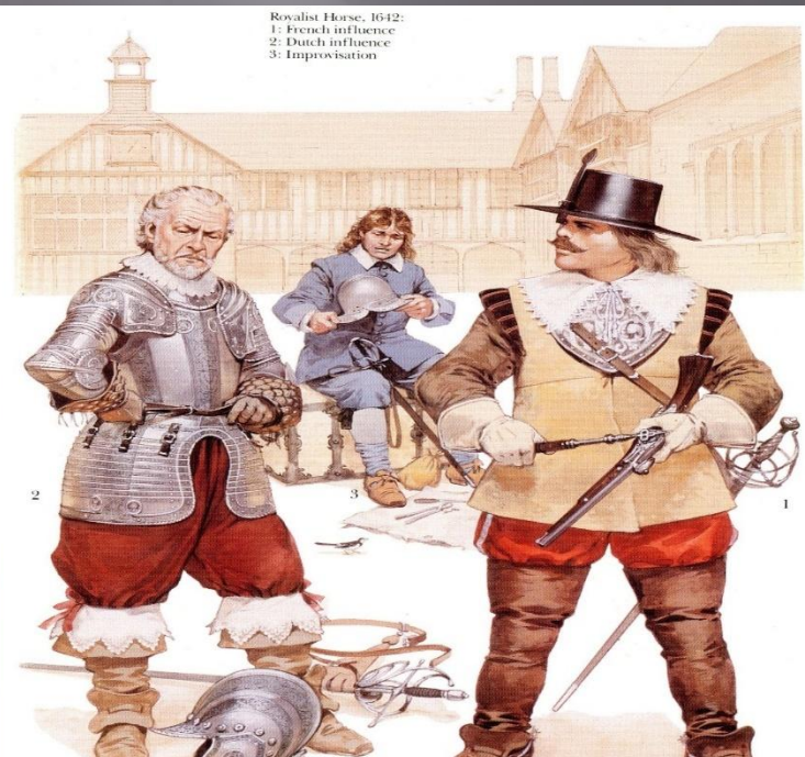
Royalist Horse, 1642: 1: French influence 2: Dutch influence 3: Improvisation