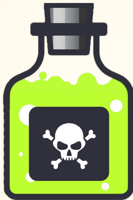
Контакт с вредными веществами