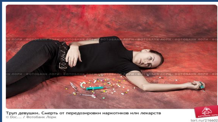
Труп девушки. Смерть от передозировки наркотиков или лекарств