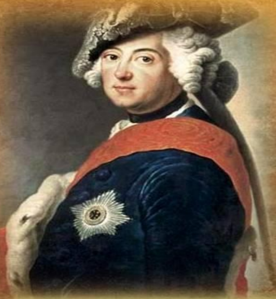
ФРИДРИХ II Великий – король Пруссии [1740–86] из династии Гогенцоллернов

расширение системы начального образования