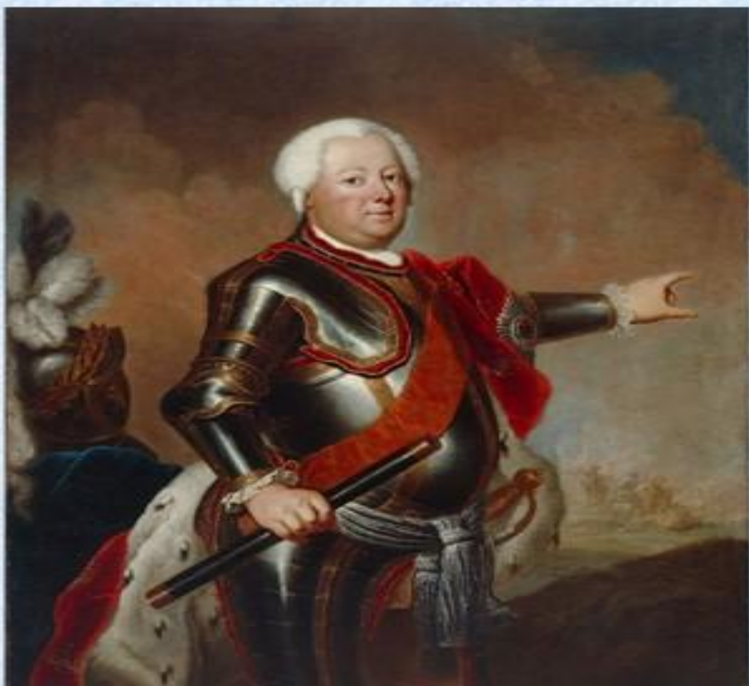
Фридрих Вильгельм I, король Пруссии (1713 – 1740), «король-солдат».