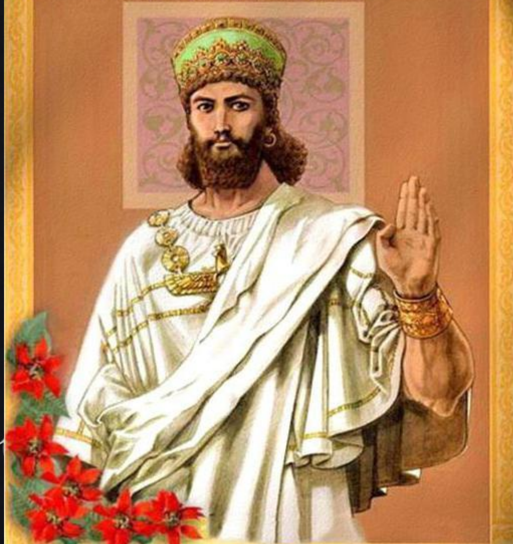
CYRUS THE GREAT

Тим часом у Вавилона з'явився грізний ворог — перси. У 539 р. до н. е. перський цар Кір II без особливих труднощів підкорив Вавилон.