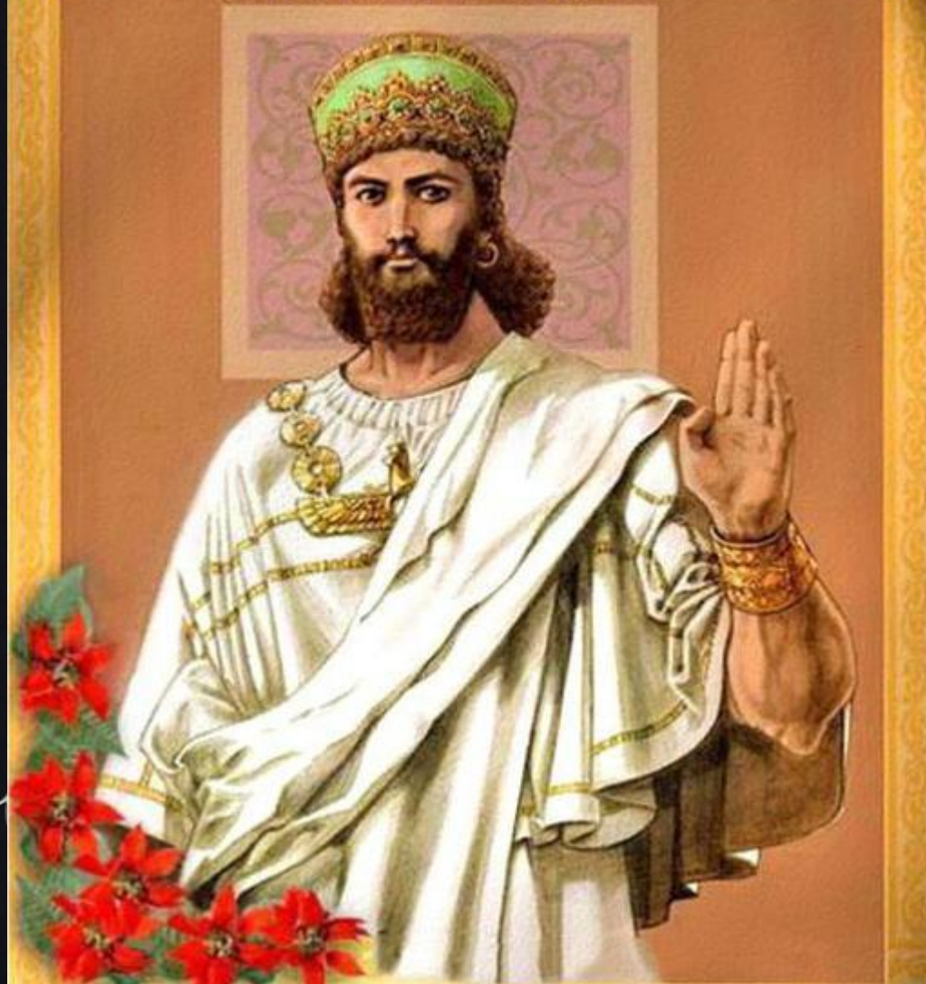
CYRUS THE GREAT

Тим часом у Вавилона з'явився грізний ворог — перси. У 539 р. до н. е. перський цар Кір II без особливих труднощів підкорив Вавилон.