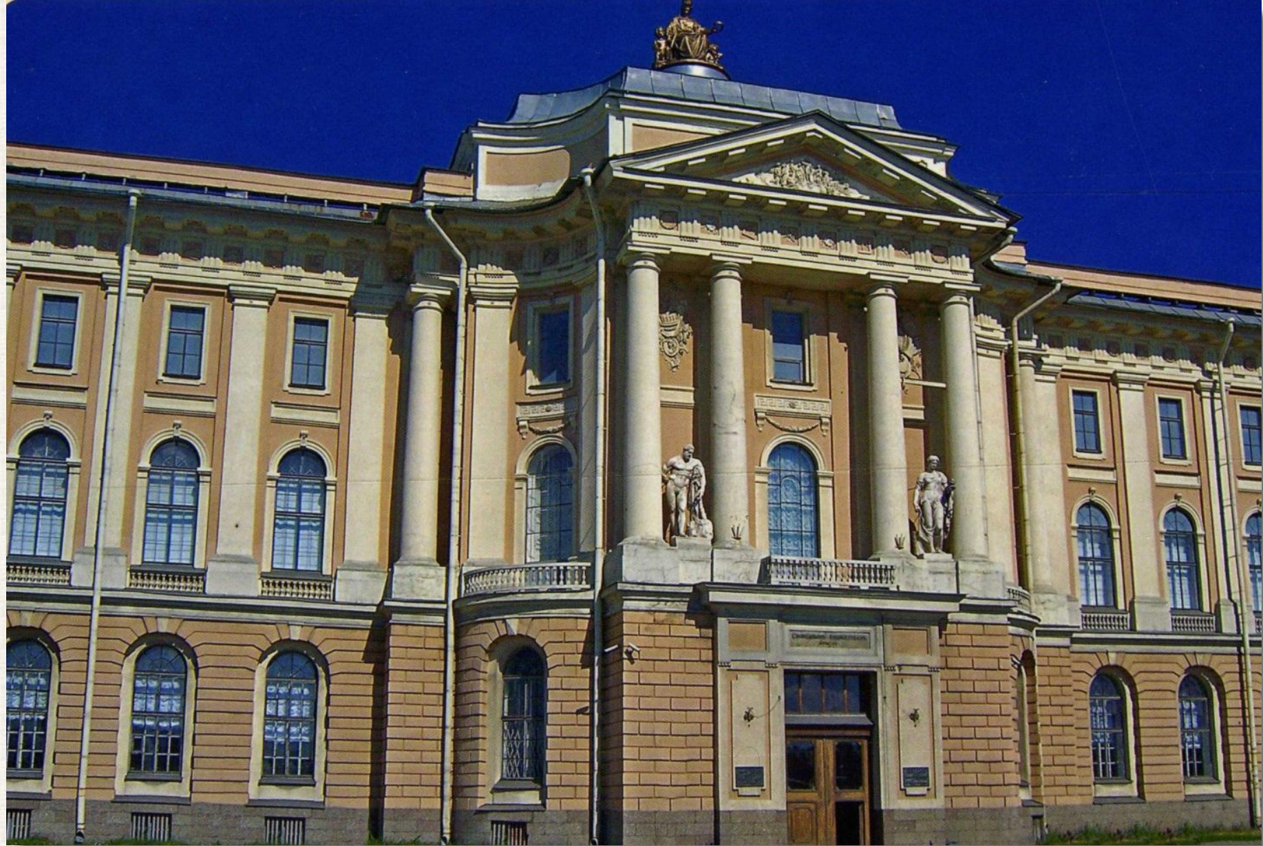
Здание Академии художеств Архитектор: Жан Батист Валлен-Деламот