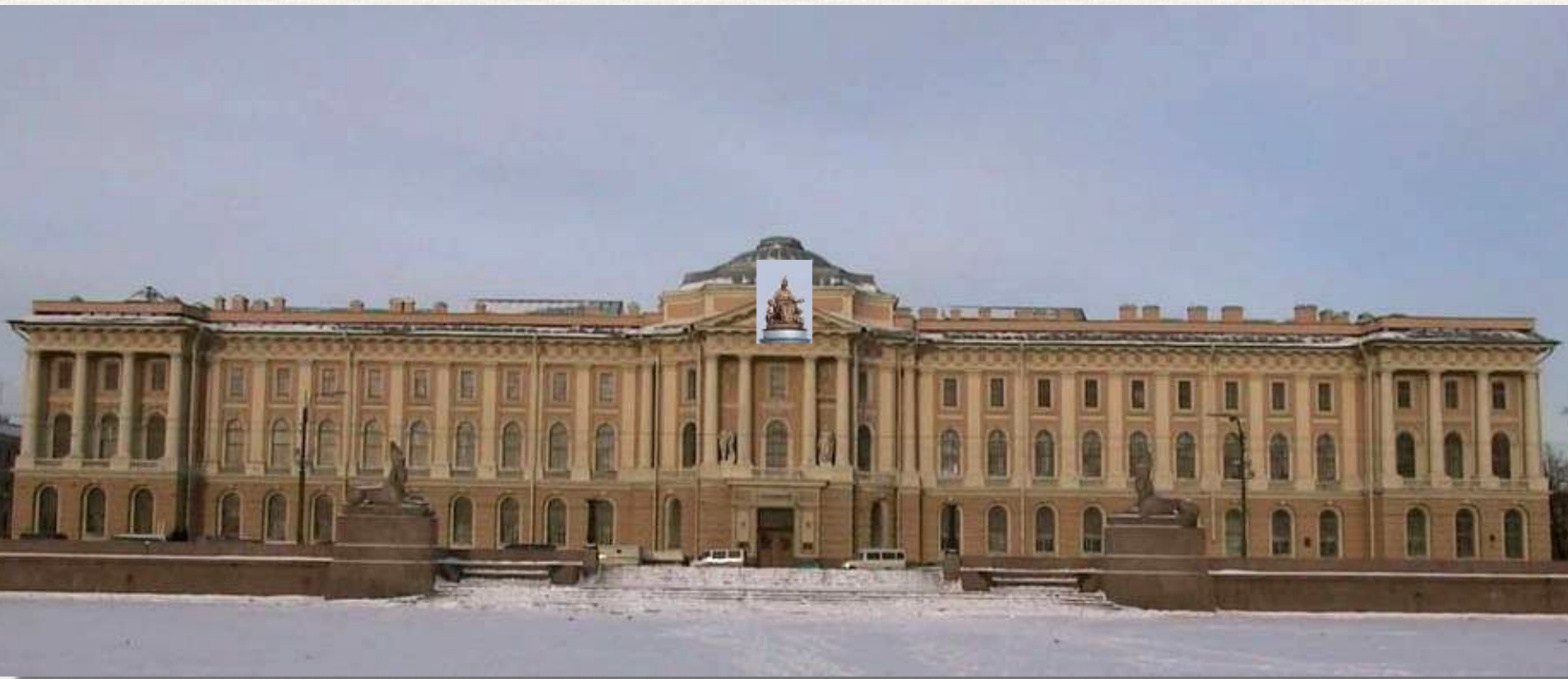
Здание Академии художеств Архитектор: Жан Батист Валлен-Деламот