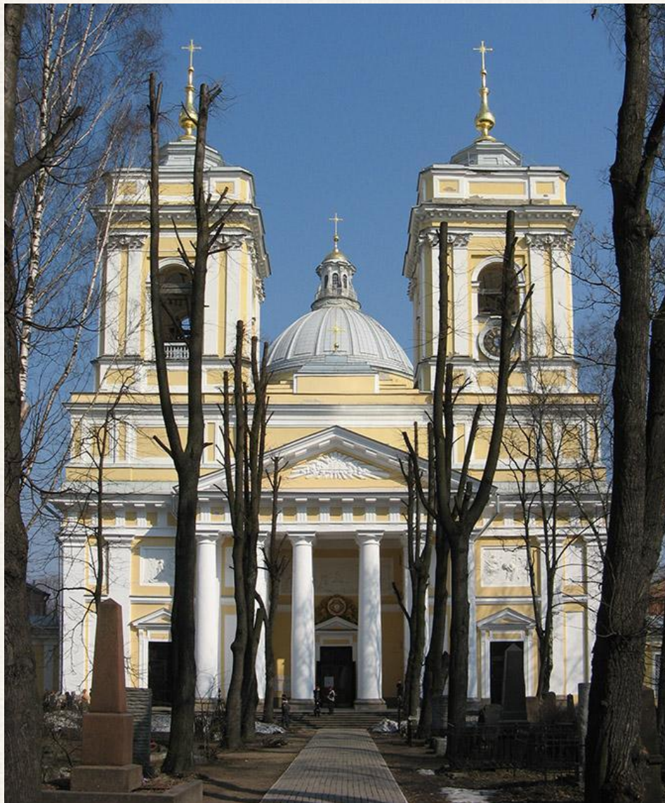
Троицкий собор Александро-Невской лавры Архитектор: Иван Егорович Старов