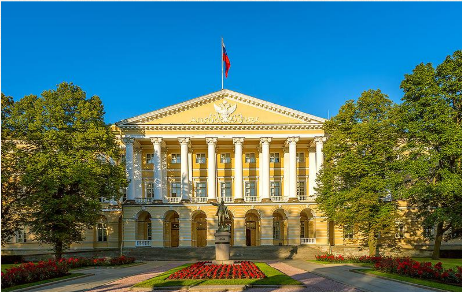
Здание Смольного института Архитектор: Джакомо Кваренги