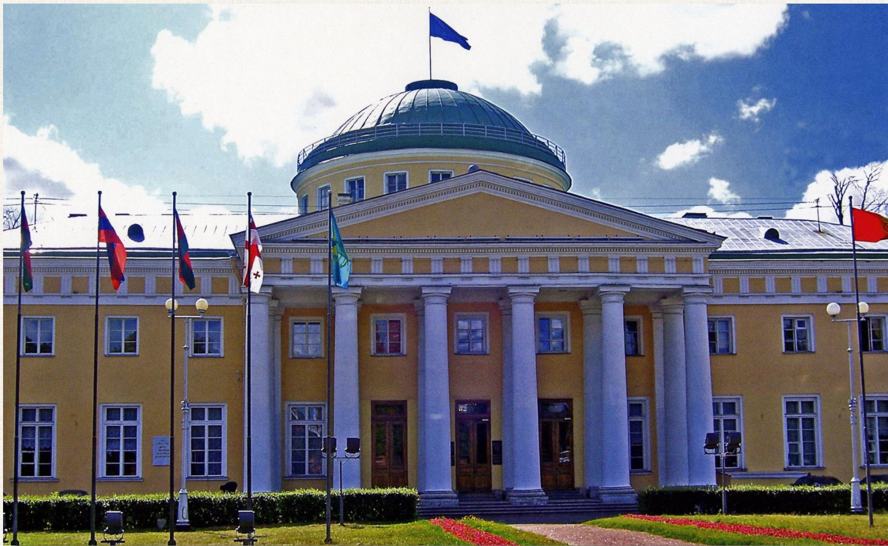
Таврический дворец Архитектор: Иван Егорович Старов