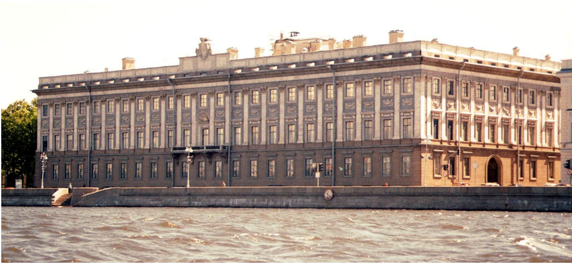
Мраморный музей Архитектор: Антонио Ринальди