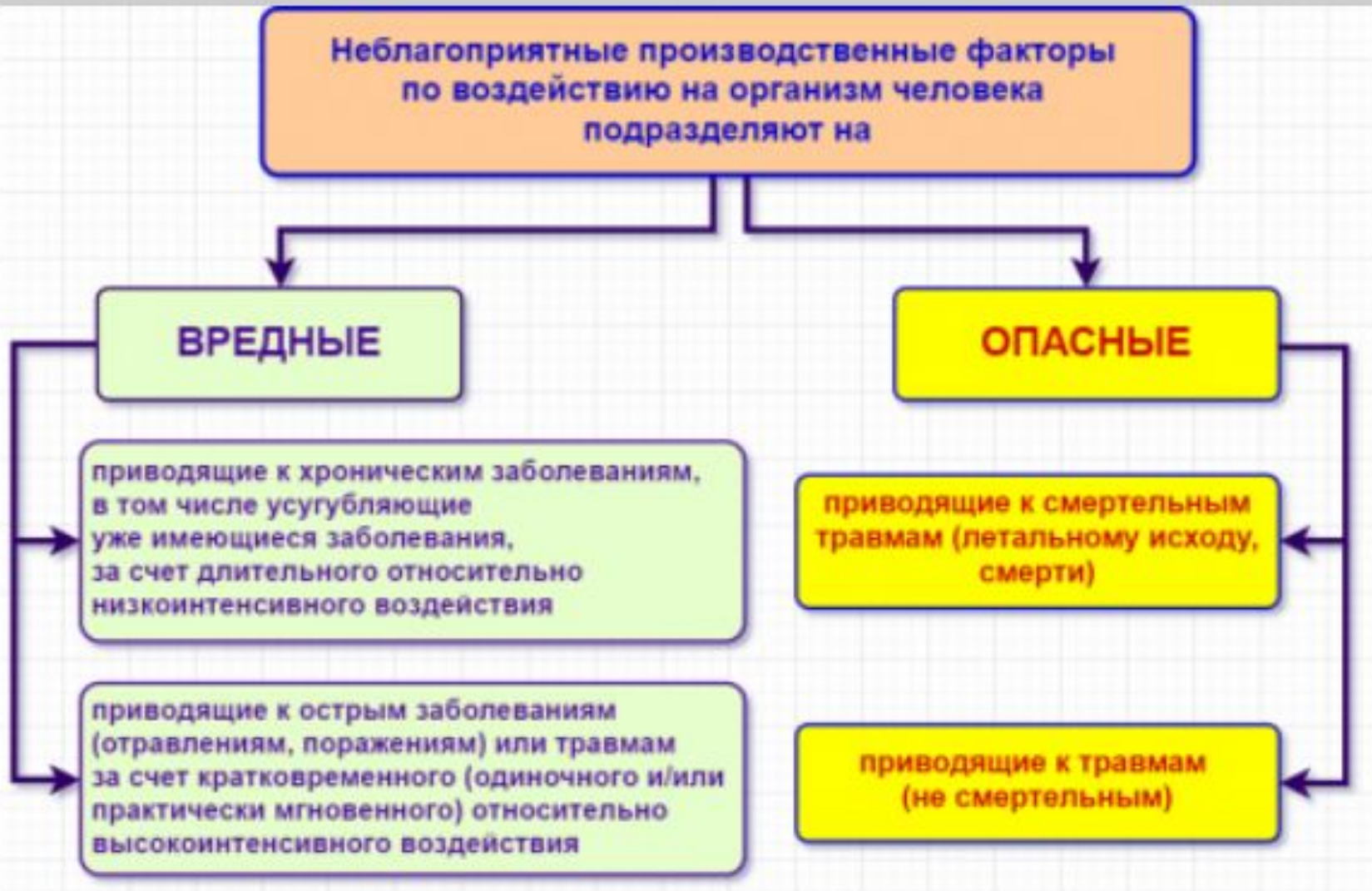
Схема классификации неблагоприятных производственных факторов