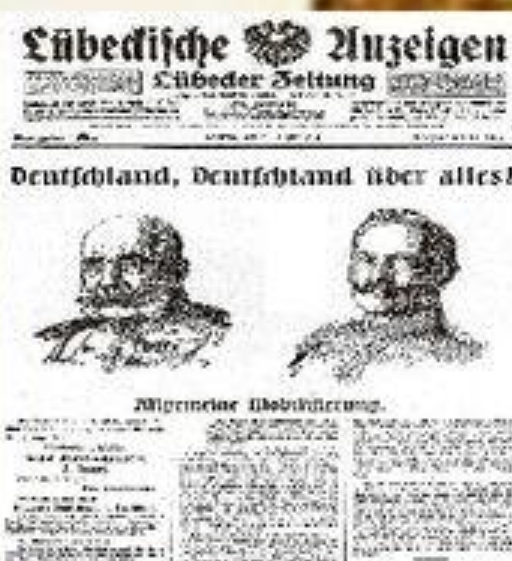
Титульная страница издания «Lübeckische Anzeigen»