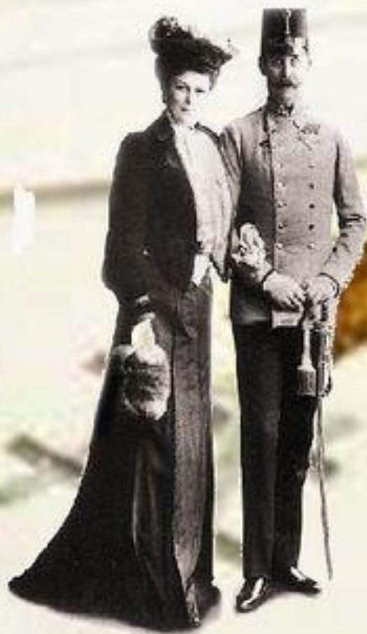
Франц Фердинанд и София

28 июня 1914 года член сербской националистической группировки «Млада Босна» Гаврила Принцип застрелил австрийского эрцгерцога, наследника австро-венгерского престола Франца Фердинанда и его супругу , которые совершали визит в Боснию, присоединенную к Австро-Венгрии в 1908 году.