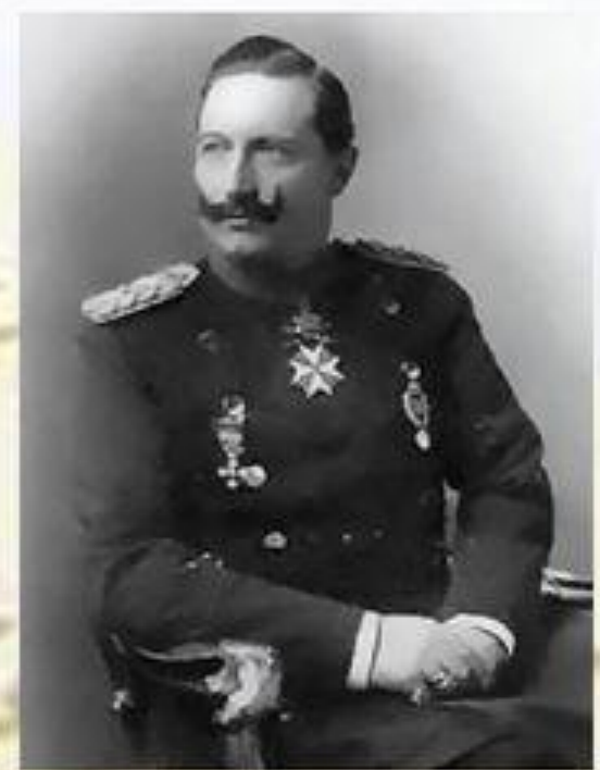
Император Вильгельм II