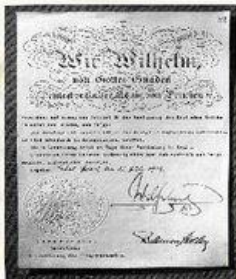
Немецкая декларация о начале войны