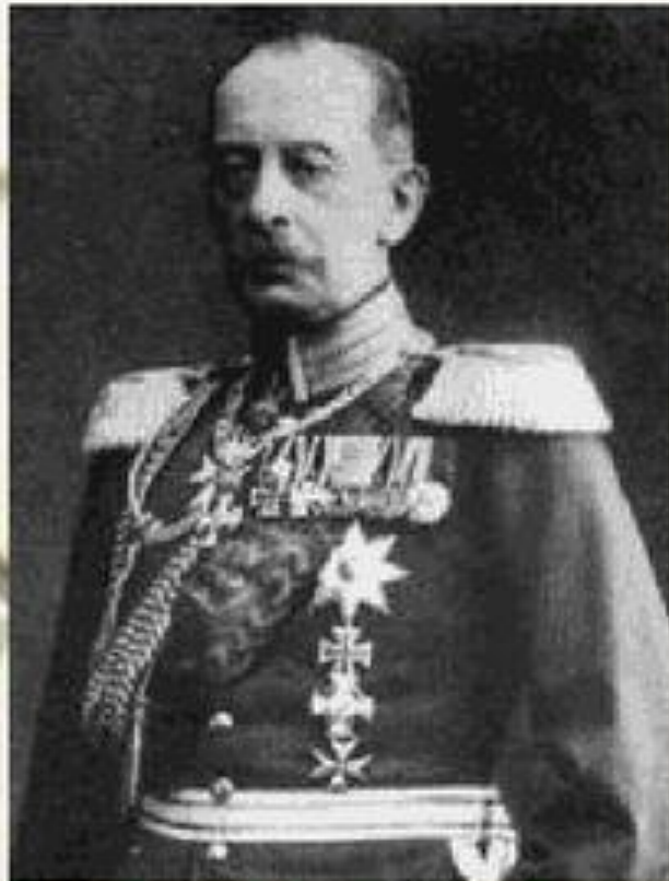
Альберт фон Шлиффен

Был разработан начальником немецкого Генерального штаба Альфредом фон Шлиффеном в начале XX века (после отставки Шлиффена, модифицирован Гельмутом фон Мольтке)