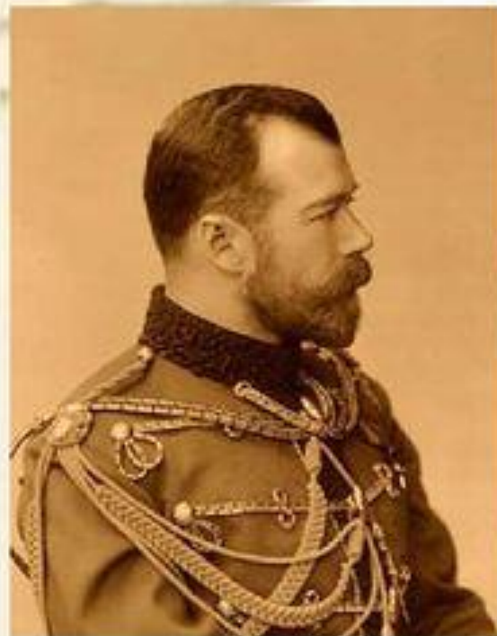
Император Николай II