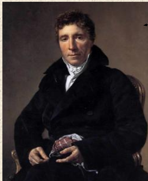
2 консул Эммануэль – Жозеф Сийес