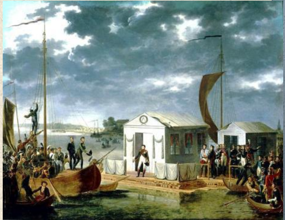
Встреча императоров в Тильзите

Наполеон заклучил мир с Россией. Два императора встретились в Тильзите . На плоту они обменялись рукопожатиями и подписали мирный договор.