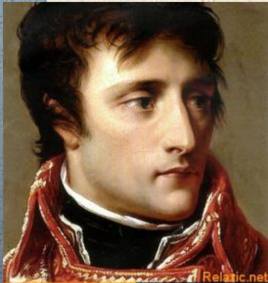
1 консул- Наполеон Бонапарт