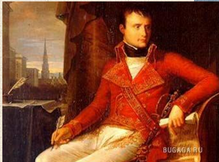
Первый консул – Бонапарт