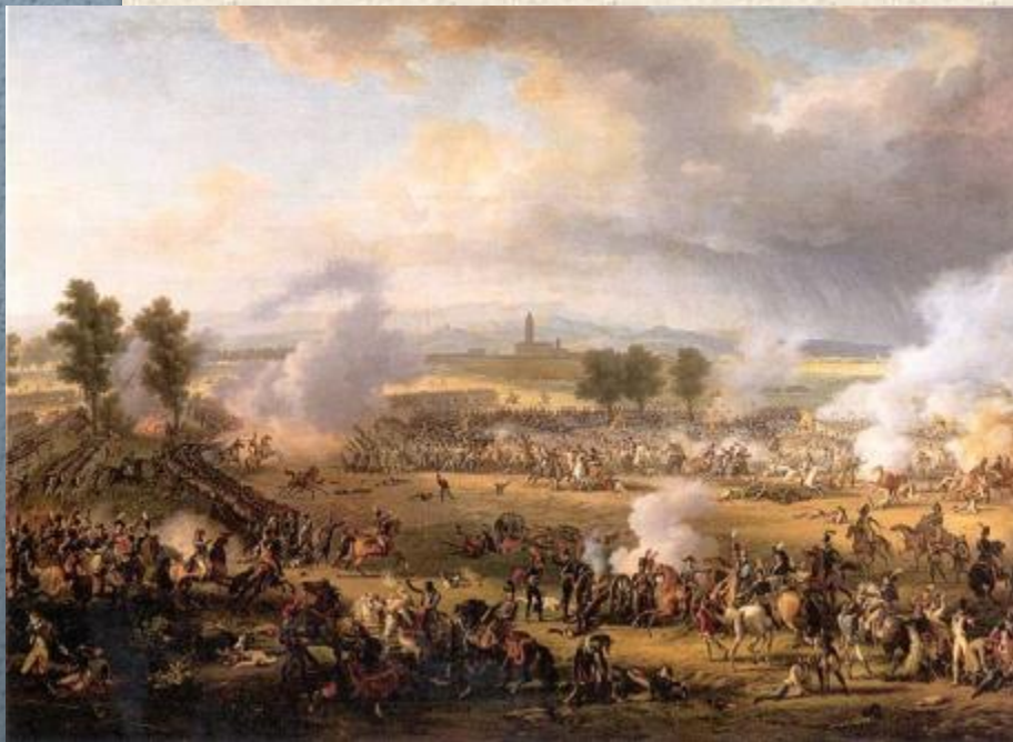
Битва при Маренго