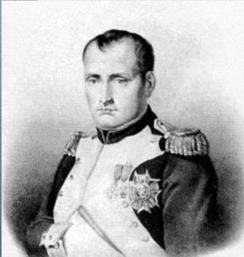
Первый консул – Бонапарт

Наибольшими правами обладал Первый консул, который мог объявлять войну и заключать мир, издавать законы, назначать и смещать министров