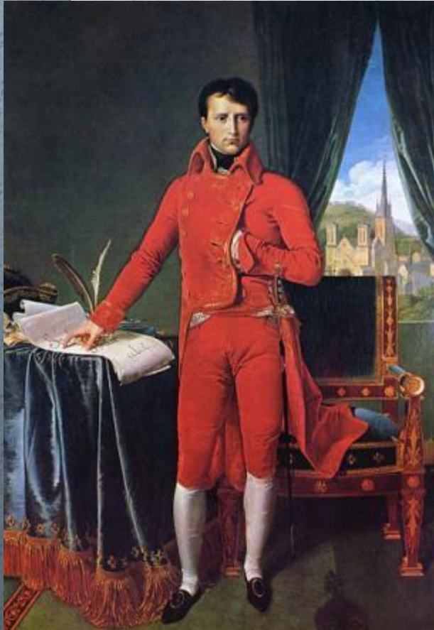
Первый консул – Бонапарт

В годы правления Наполеона экономическое положение государство ухудшилось: