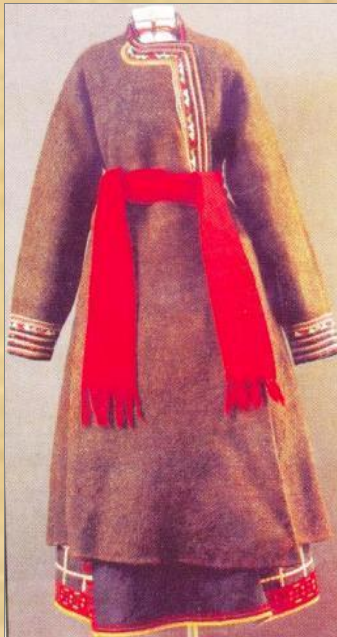
Женская верхняя одежда, конец 19 века.