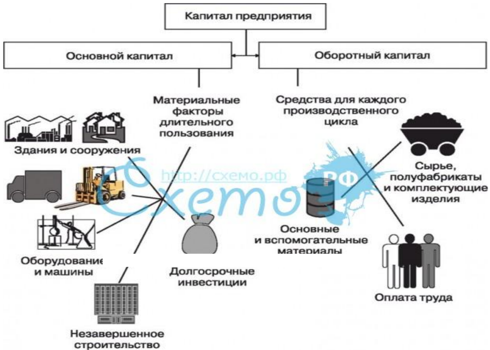
Рис. 4.15. Основной и оборотный капитал