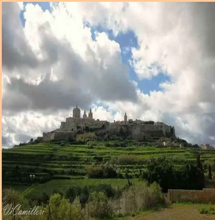
Найвища точка Мальти