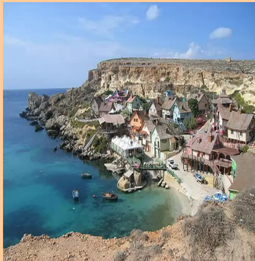
Місто тиші, мовчання.