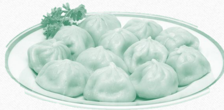
Черничные с говядиной