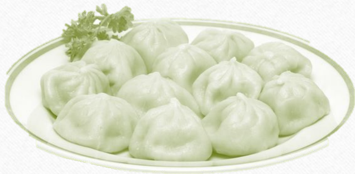
Яблочные с курицей