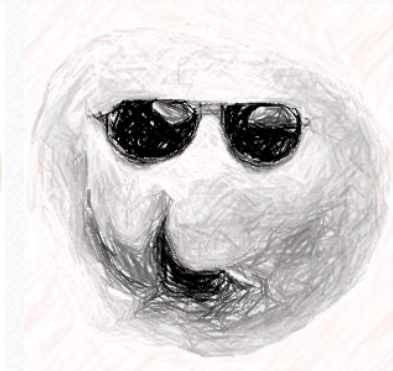
И для голодных художников