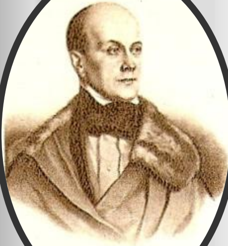
П. Я. Чаадаев

Лицом, на которое указывали как на прототип Чацкого , был П. Я. Чаадаев , был П. Я. Чаадаев. Пушкин , был П. Я. Чаадаев. Пушкин писал П. А. Вяземскому , был П. Я. Чаадаев. Пушкин писал П. А. Вяземскому: «Что такое Грибоедов? Мне сказывали, что он написал комедию на Чедаява; в теперешних обстоятельствах это чрезвычайно благородно с его стороны». Но сближение Чацкого с Чаадаевым сохранилось в устной, потом в печатной традиции.