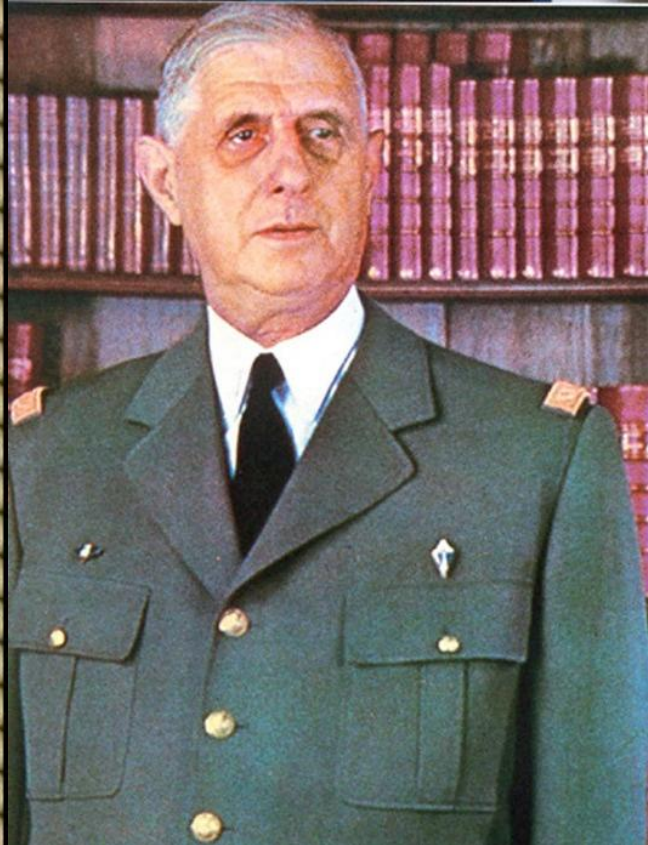
Шарль де Голль

Шарль де Голль лично участвовал в разработке новой конституции В 1958 г. – принята новая Конституция (на референдуме за нее проголосовали 4/5 французов), началась Пятая республика.