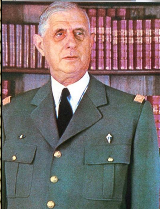
Шарль де Голль

Шарль де Голль – руководитель движения «Свободная Франция»