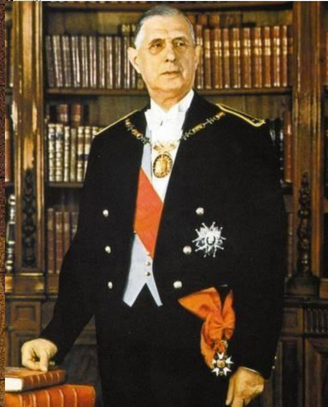
Шарль де Голль