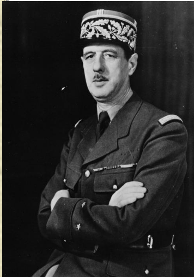
Шарль де Голль