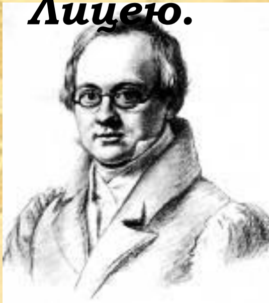
Антон Антонович Дельвиг