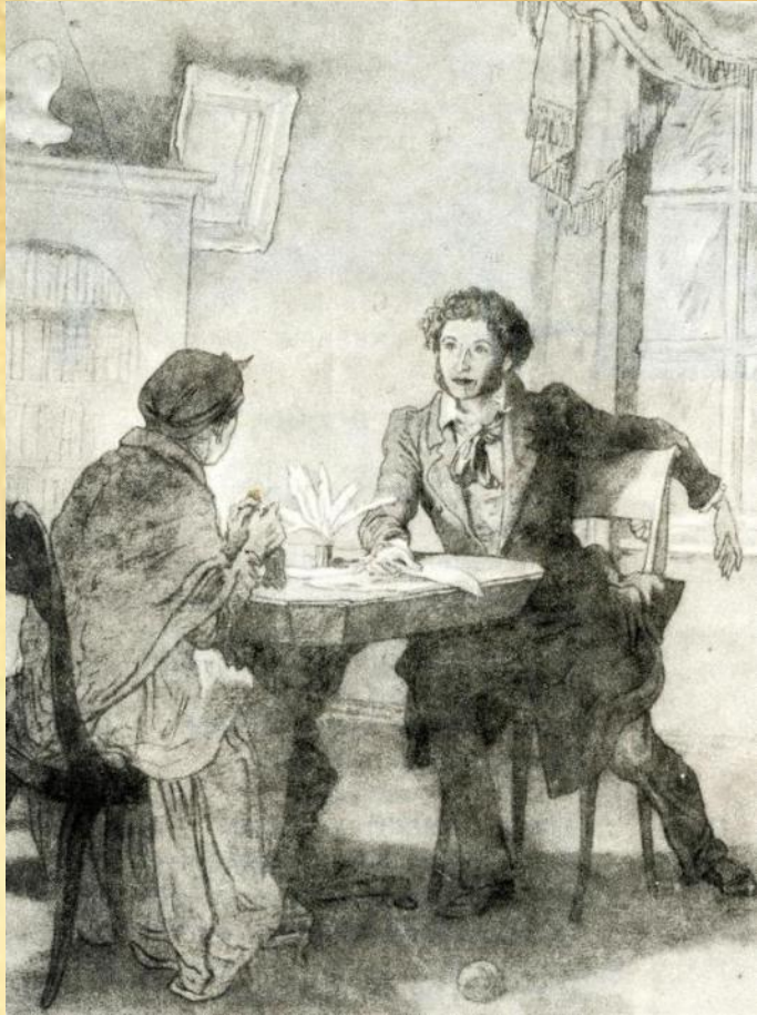
Иллюстрация к стихотворению «Зимний вечер»

Забота и любовь Арины Родионовны скрашивали поэту ссылку. Пушкин по-настоящему крепко любил свою няню и написал несколько трогательных стихотворений, к ней обращенных.