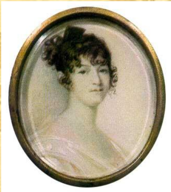
Н.О. Пушкина. 1800-е гг.

Мать, Надежда Осиповна , приходилась внучкой араму Петра I, впоследствии русскому генералу Ганнибалу.