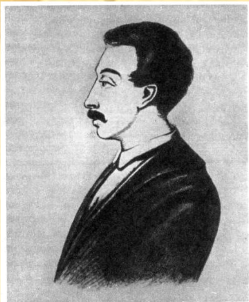
Вильгельм Карлович Кюхельбекер