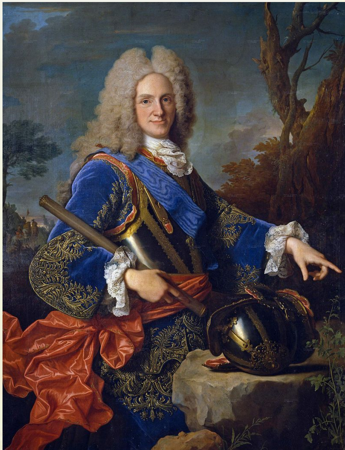
Филипп V Испанский

Война Англии, Австрии, Голландии против Франции и Испании