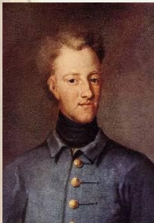
Карл XII, шведский король