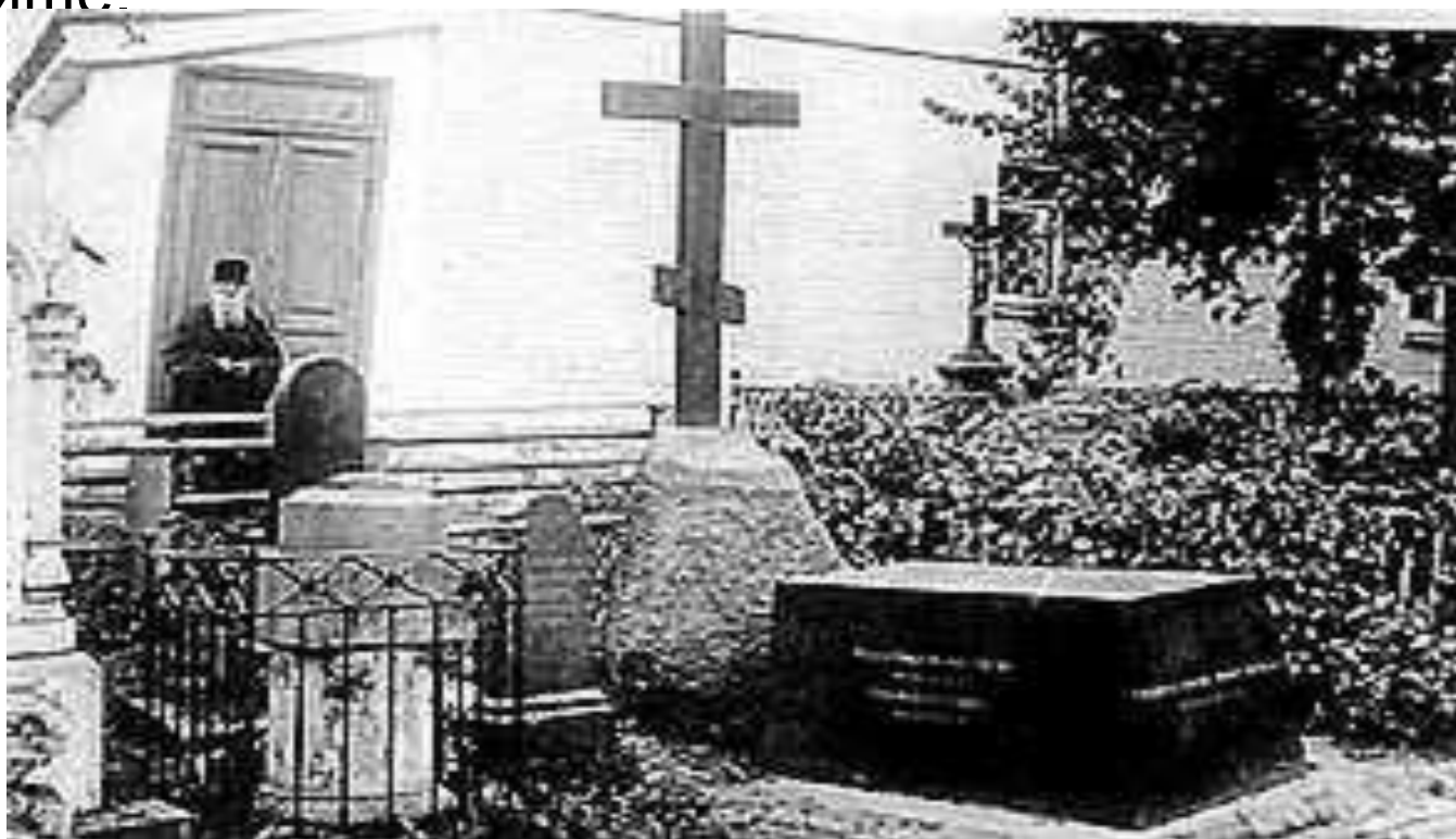
Бывшая могила Н.В. Гоголя в Свято-Даниловом монастыре в Москве

Похороны писателя состоялись при огромном стечении народа на кладбище Свято-Данилова монастыря, а в 1931 останки Гоголя были перезахоронены на Новодевичьем кладбище.