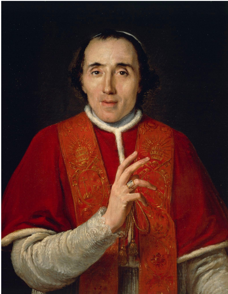
Пий VII — Папа Римский с 14 марта 1800 года по 20 августа 1823 года.