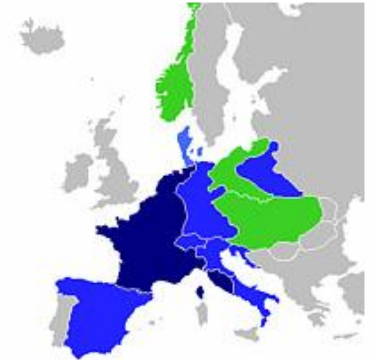
Первая французская Империя, 1811 год