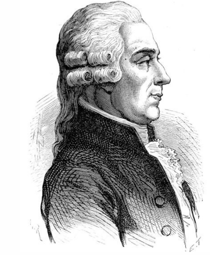
Тибодо, Антуан Клер

«Вот, все мои предчувствия сбылись! Эта кампания станет роковой для империи, гибельной для Франции»