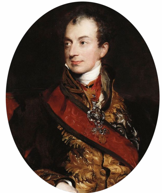
Клеменс фон Меттерних (1773-1859)