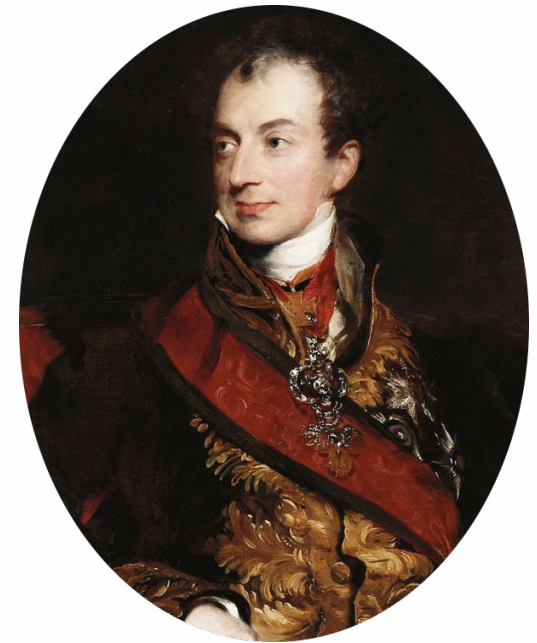
Клеменс фон Меттерних (1773-1859)