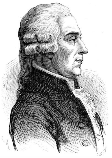
Тибодо, Антуан Клер

«Вот, все мои предчувствия сбылись! Эта кампания станет роковой для империи, гибельной для Франции»