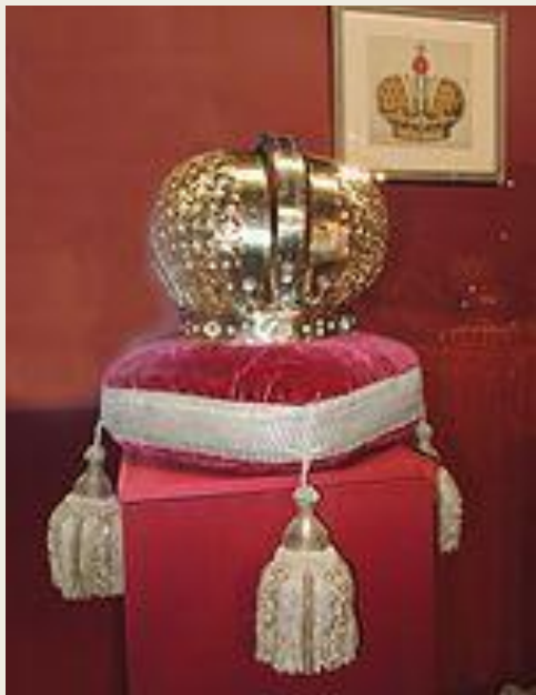
Корона Екатерины I (1724) хранится в оружейной палате