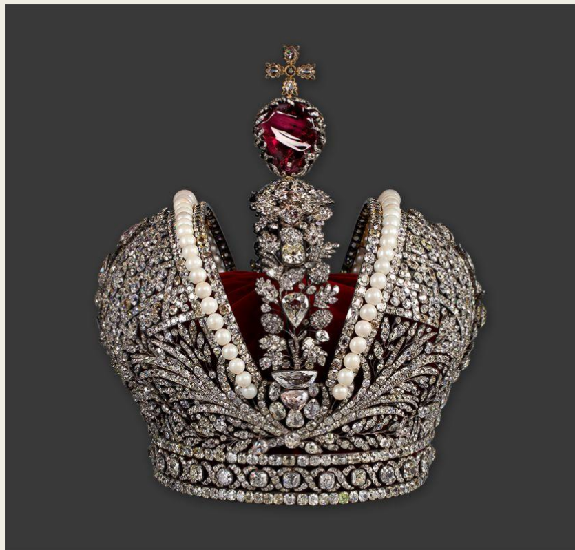
Большая императорская корона

В русском царстве использовались Шапки Русского царства, в частности, для коронаций — Шапка Мономаха. Последний царь и первый император Пётр Великий в качестве императора не короновался, будучи уже венчан на царство по старому обычаю. Первой императорской коронацией в России стал обряд, проведённый им над своей женой Екатериной Алексеевной, будущей самодержицей Екатериной I. Ради этого обряда были тщательно пересмотрены старинные царские традиции, и много заимствовано из обрядов Западной Европы, в частности, Священной Римской империи. Первая русская императорская корона была изготовлена именно для Екатерины I. Однако вскоре после праздника эта корона была разобрана, и в Оружейной палате сохранился только её обод.