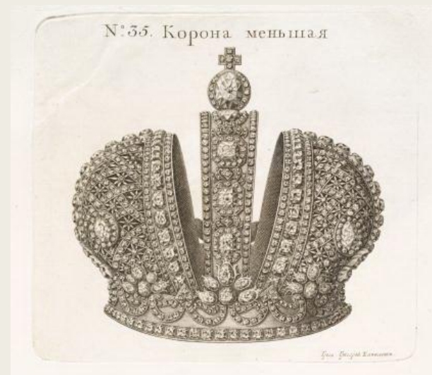
Малая корона Елизаветы Петровны (1742) разобрана