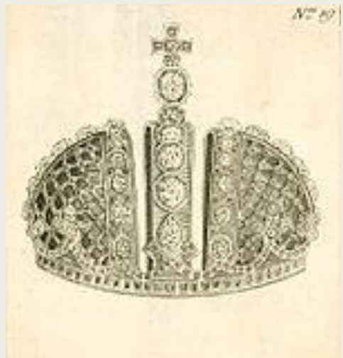
Малая корона Анны Иоанновны (1730) разобрана