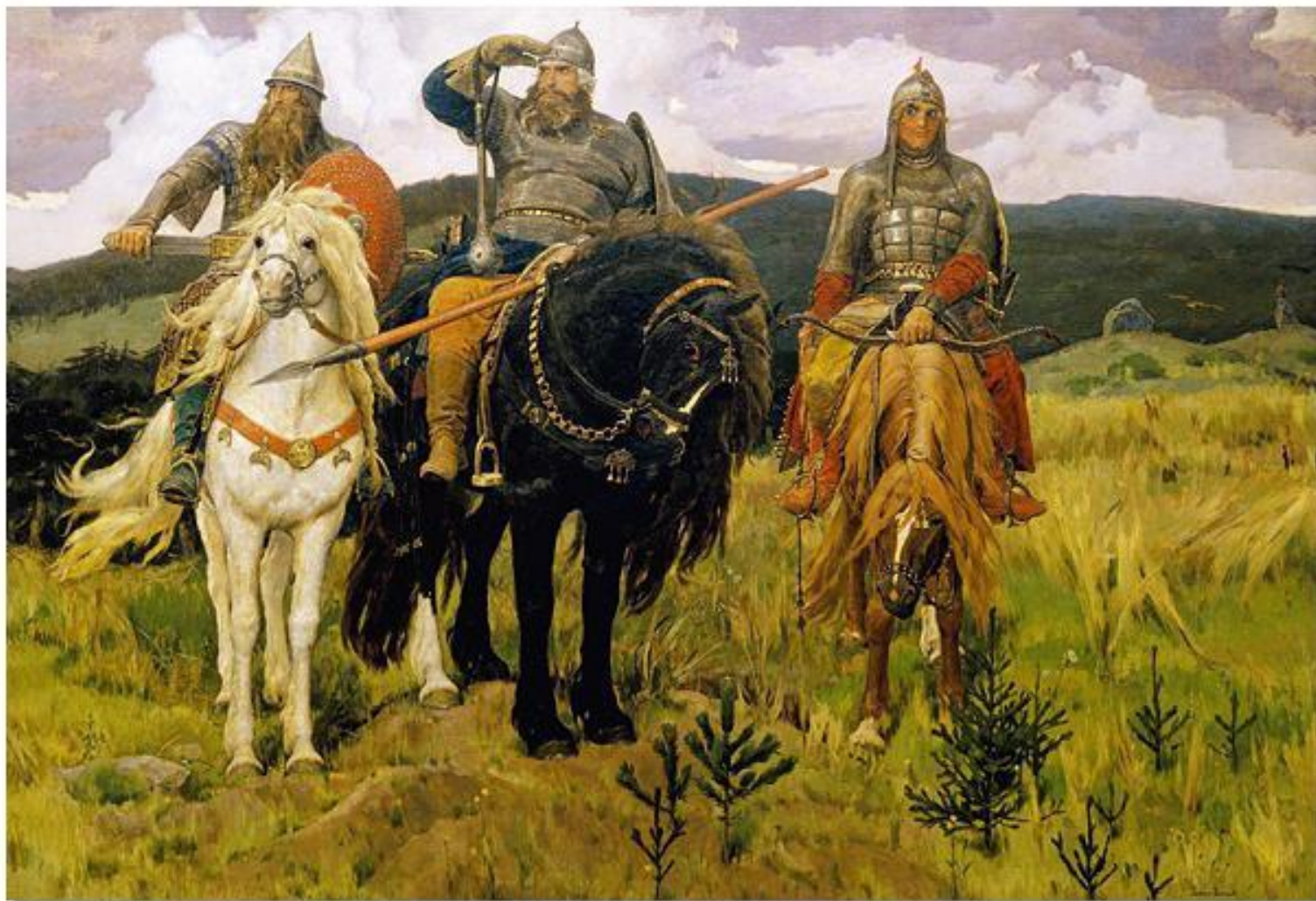
Виктор Михайлович Васнецов «Богатыри».