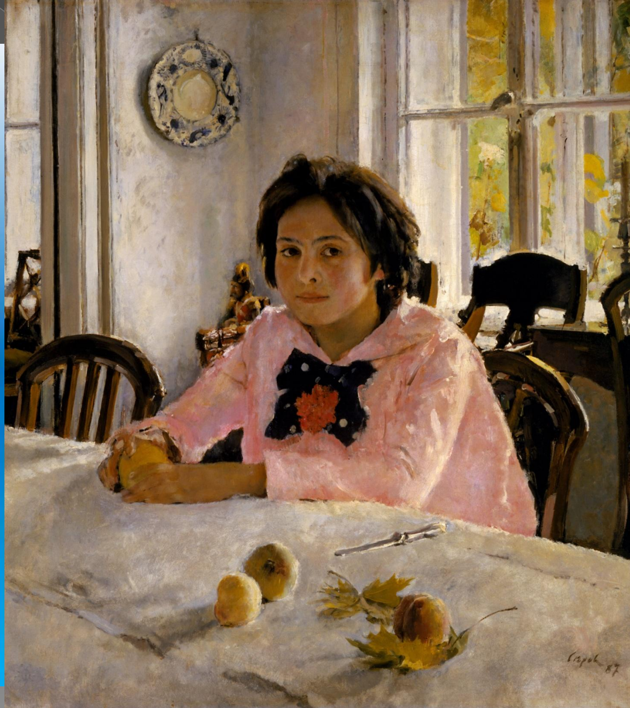
«Девочка с персиками» Валентин Александрович Серов (1865-1911)