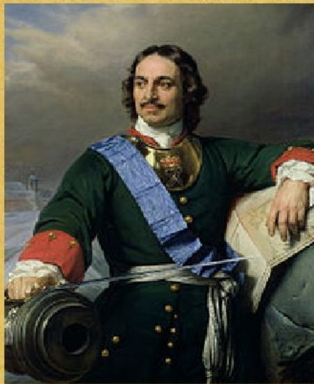
Поль Деларош. Портрет Петра I (1838).