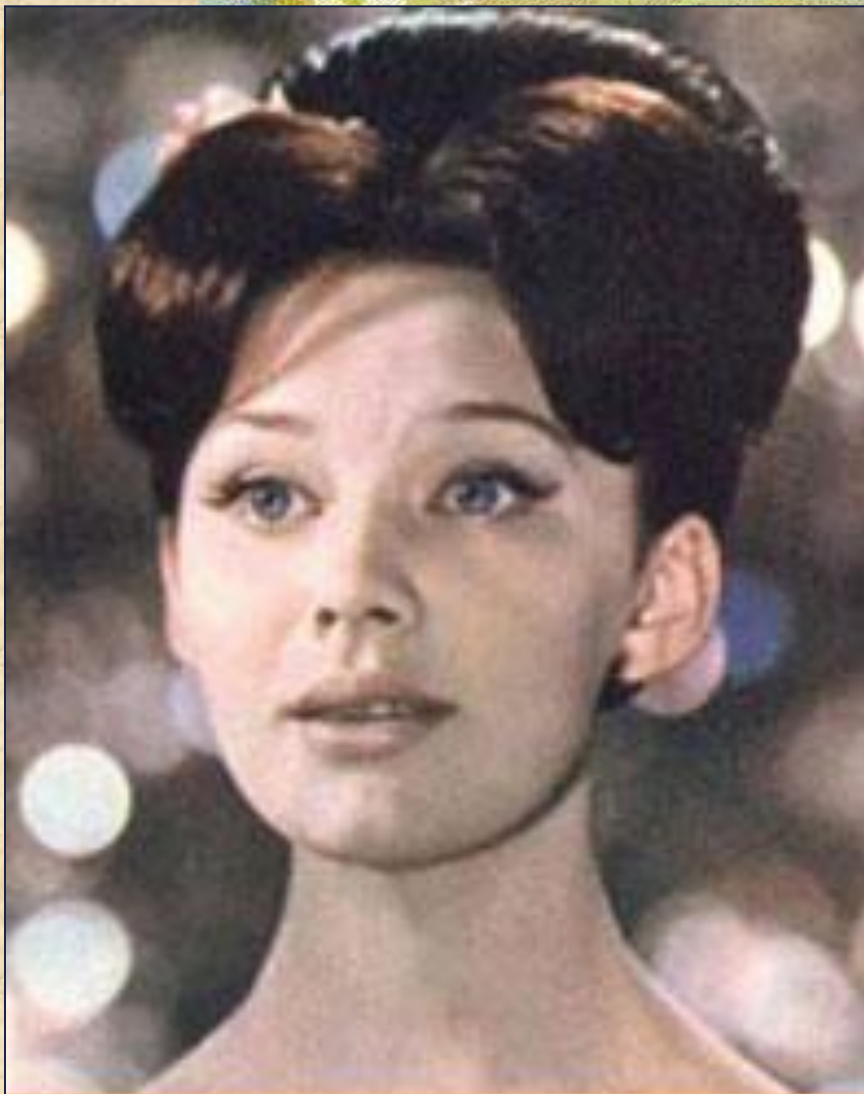
Людмила Савельева — Наташа Ростова. «Война и мир», 1968 год