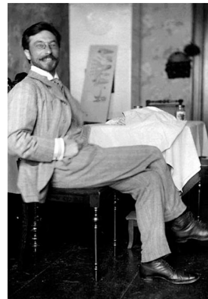
Василий Васильевич Кандинский