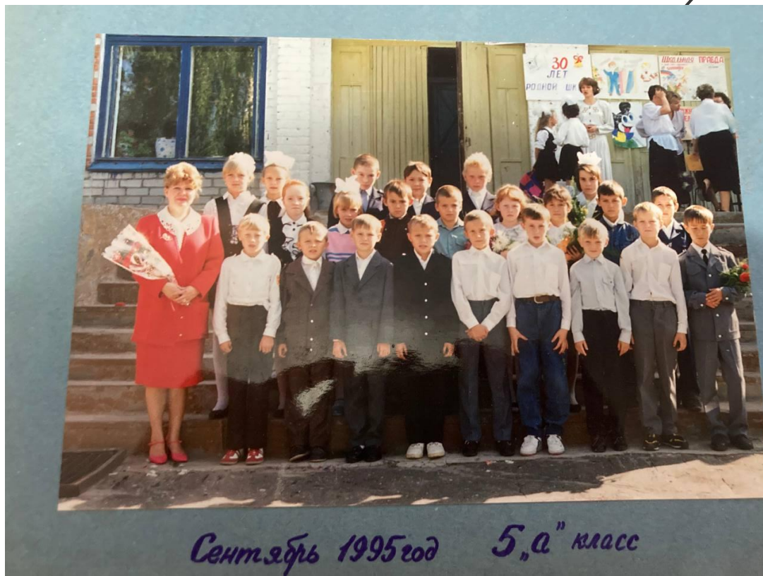
Сентябрь 1995 год 5,а" класс