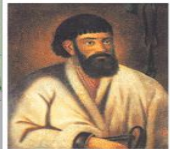
Е. И. Пугачёв в пленении. Неизвестный художник, XVIII в.