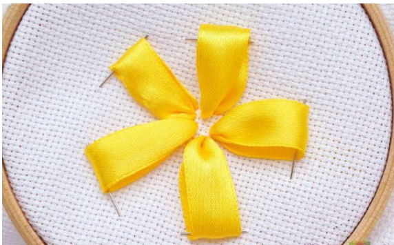
Стежок «Петельки по кругу»