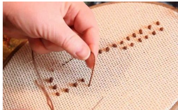
Стежок «Французский узелок»