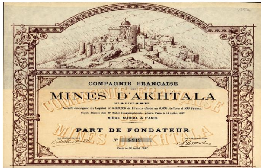
Французская облигация Ахталинского месторождения в Армении.

Страна наращивала темпы экономического развития. Появлялись крупные монополии, промышленные и банковские. Особенностью Франции стал вывоз капитала. Но развитие промышленности тормозилось отставанием сельского хозяйства.