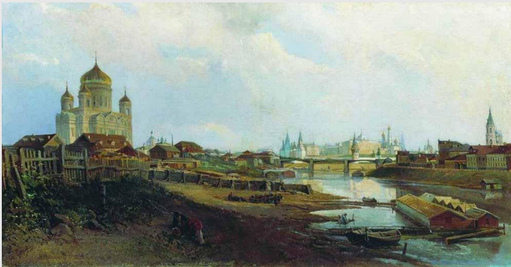
Маковский Н. Е., 1873