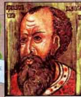
Царь Иван IV