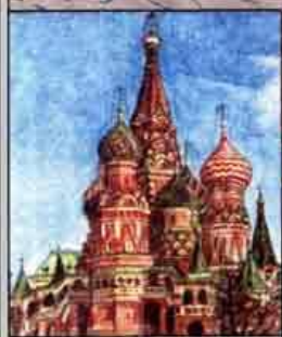
Собор Василия Блаженного в Москве