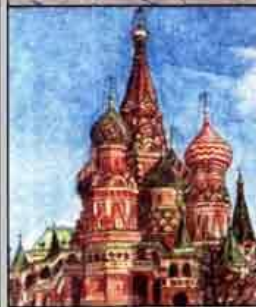
Собор Василия Блаженного в Москве