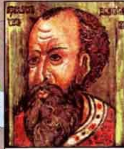
Царь Иван IV