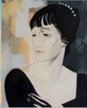
Юрий Анненков. Ахматова 1921г.