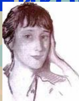
А.Модильяни. Ахматова 1911г.