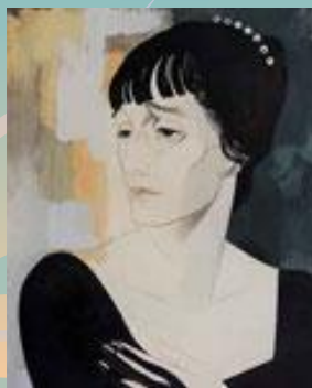
Юрий Анненков. Ахматова 1921г.