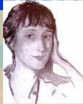
А.Модильяни. Ахматова 1911г.