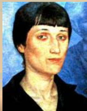
К.Петров-Водкин. Ахматова, 1922 г.