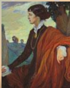
Ольга Делла-Вос Кардовская. Ахматова 1914г.