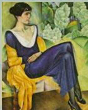
Натан Альтман. Ахматова 1915г.