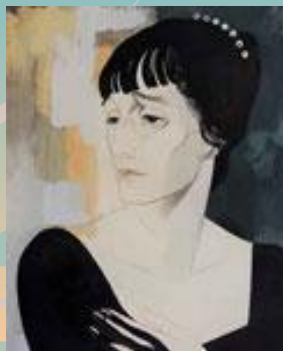
Юрий Анненков. Ахматова 1921г.