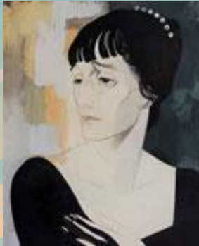
Юрий Анненков. Ахматова 1921г.