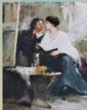
Н.Третьякова. Ахматова и Модильяни.