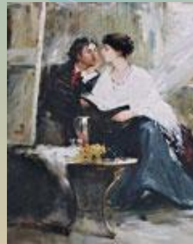
Н.Третьякова. Ахматова и Модильяни.