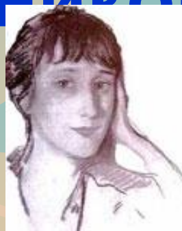
А.Модильяни. Ахматова 1911г.