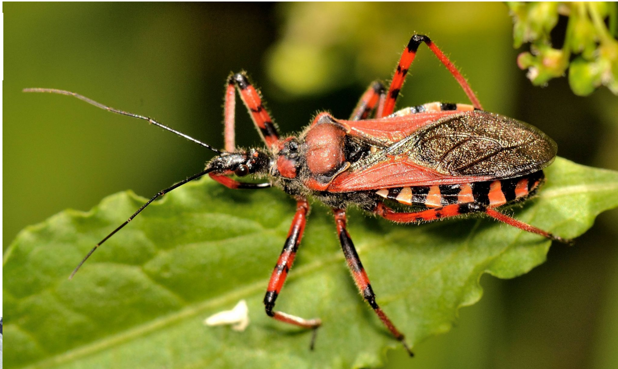
Триатомовый клоп, вызывающий болезнь Шагаса