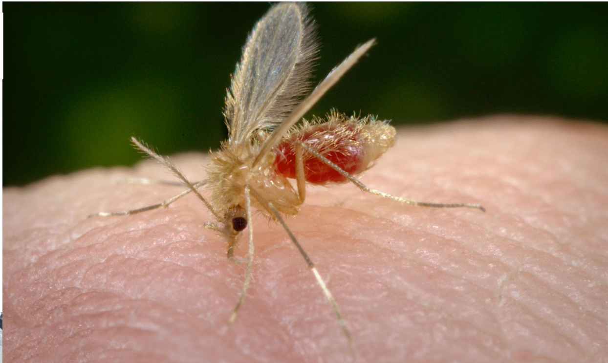
Москит Флеботомус, вызывающий Лейшманиоз