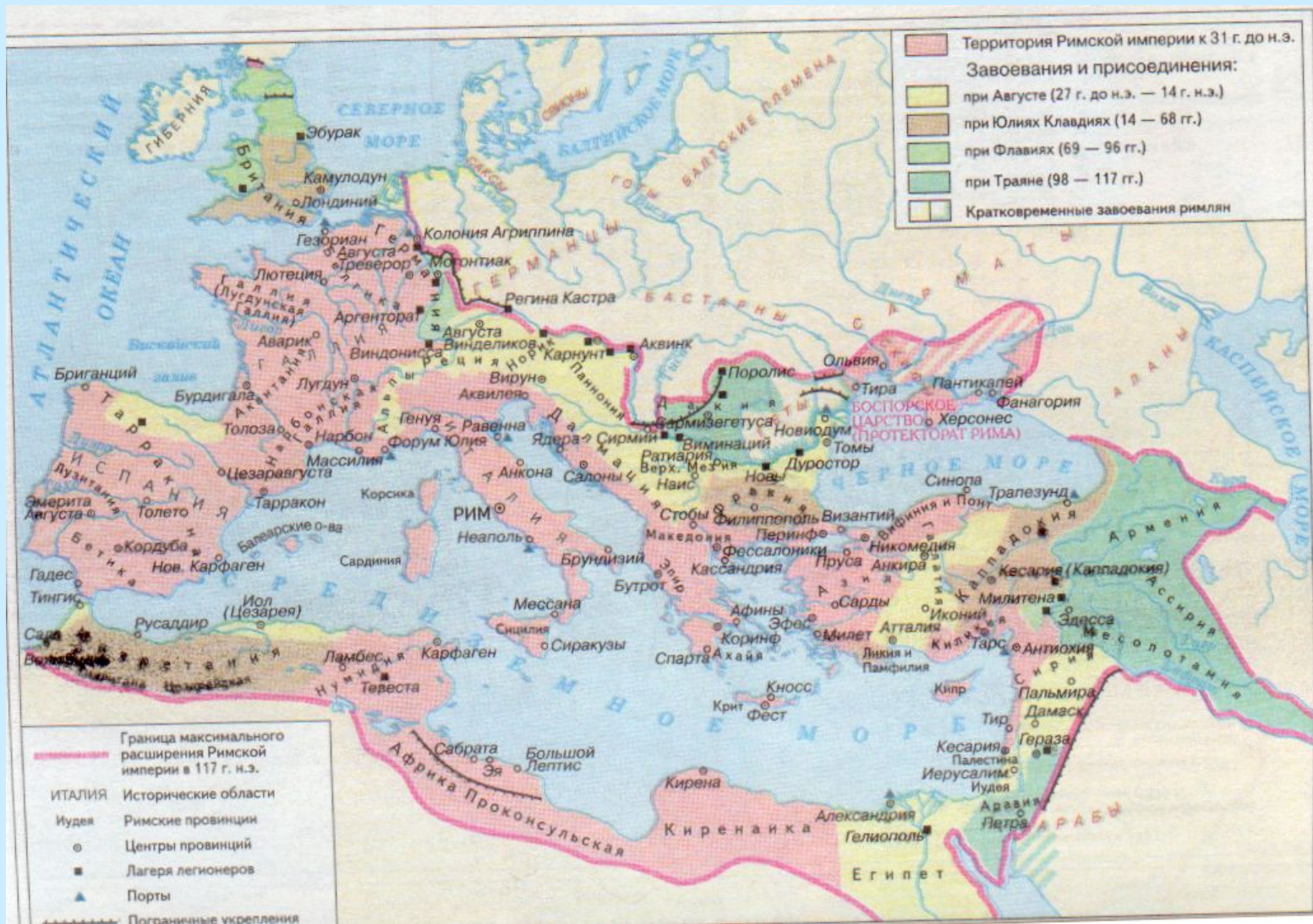
Карта Римской империи периода Принципата