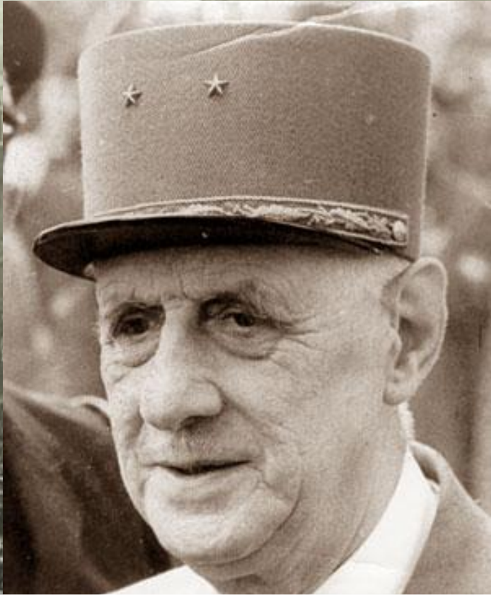
Шарль де Голь