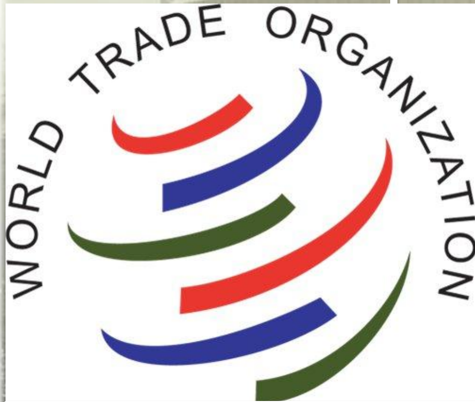
Эмблема Всемирной Торговой организации