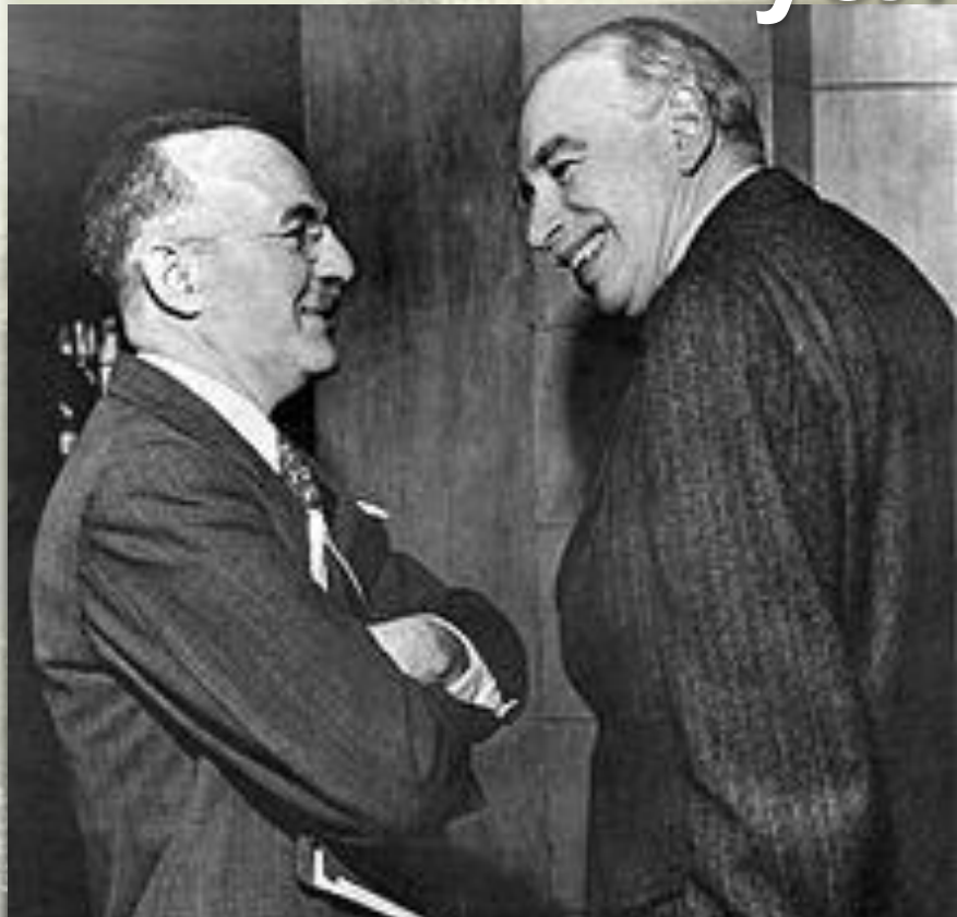
Гарри Декстер Уайт (США) (слева), и Джон Мейнард Кейнс, Великобритания (справа), на Бреттон-Вудской конференции