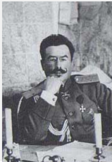
Генерал Николай Духонин

Ноябрь 1917 г. - воинскими частями, настроенными по-большевистски ликвидирована Ставка Верховного главнокомандующего во главе с генералом Н. Духониным в Могилеве (после свержения Временного правительства Ставка возглавила борьбу с большевиками).