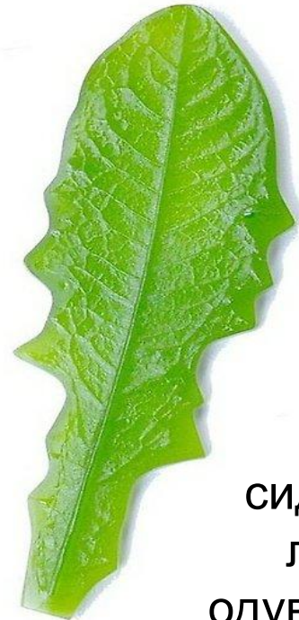
сидячий лист одуванчика