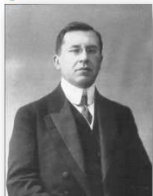
А.И. Коновалов, прогрессист