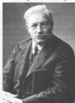
П.Н. Миллюков, кадет