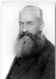
Князь Г.Е. Львов