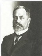
А.И. Гучков, октябрист