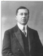
А.И. Коновалов, прогрессист