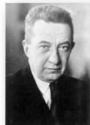
А.Ф. Керенский, эсер