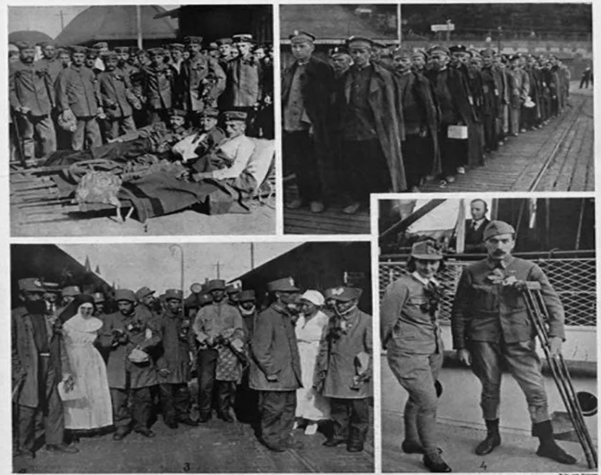
Deutsche und österreichisch-ungarische Wehrmacht-Gefangene treffen mit einem österreichischen Dampfer ein, der mit österreichischen Wehrmacht-Truppen dann wieder die Tschekoslowakei verlässt. 1. Deutsche Wehrmacht-Gefangene, die auf eine Transportbahn warten müssen, nach ihrer Rückkehr. — 2. Die österreichischen Wehrmacht-Truppen gehen an Bord. — 3. Österreichische Wehrmacht-Truppen mit ihrer Bekleidung in Safnitsh. — 4. Eine junge Österreicherin als Wehrmacht-Gefangene, die als Geisel in der russischen Lager in der nächsten Stadt verbleibt.