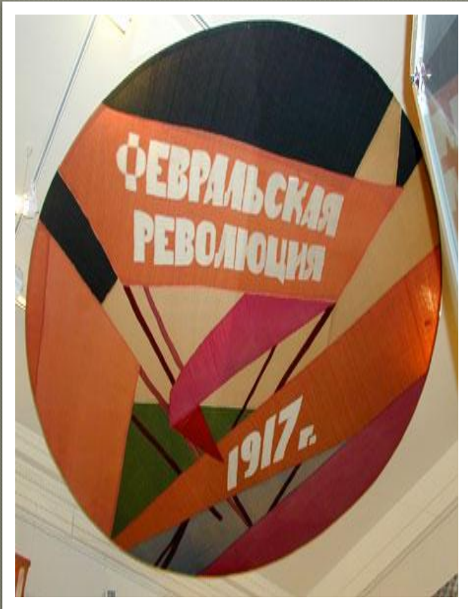
Причины и характер Февральской революции.