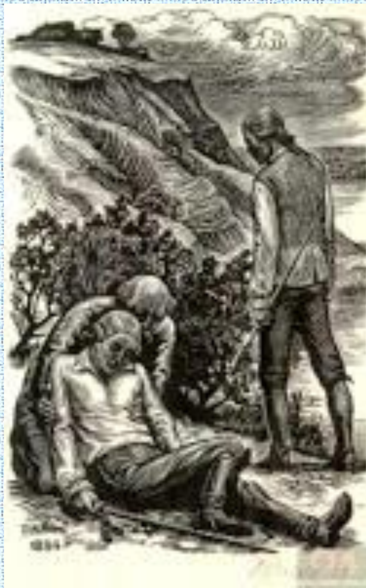
Гринева, Савельич и Швабрин. "Поединок". Художник В. Сысков

Сюжетные взаимоотношения барина Гринева со слугой Савельичем помогают А.С. Пушкину акцентировать наше внимание на вопросе глубокой связи дворянства и народа. В проблематике романа этот вопрос занимает одно из центральных мест.