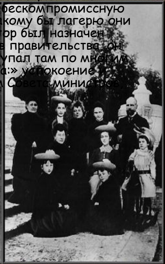
П.А. Столыпин со своим семейством на террасе Елагинского дворца