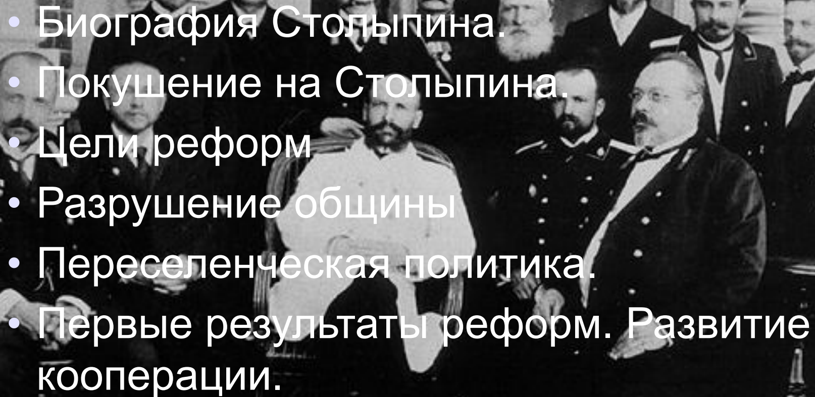
Саратовский губернатор П.А. Столыпин (в первом ряду в центре) во время посещения города Камышина. 1903 год.