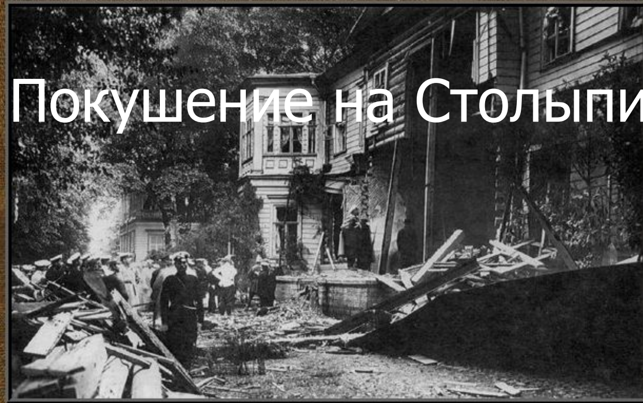
Разрушенная взрывом дача Столыпина на Аптекарском острове Санкт-Петербург, 12 августа 1906 года