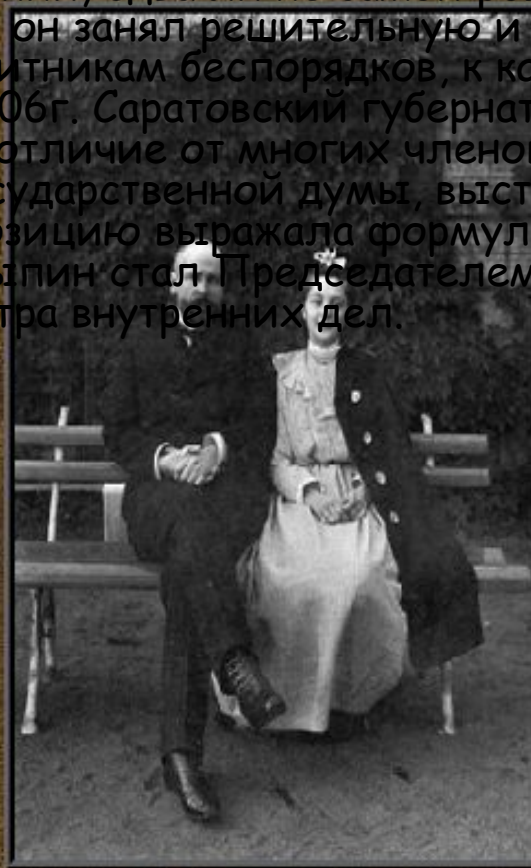
П.А. Столыпин с дочерью около Елагинского дворца