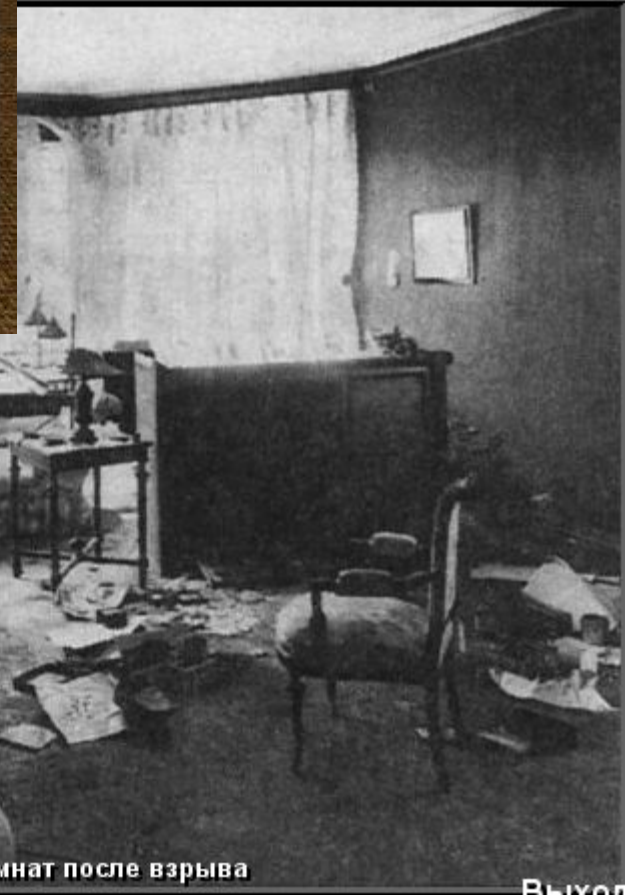
Одна из комнат после взрыва