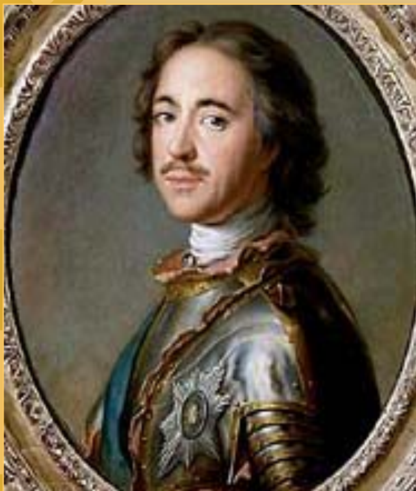
ПЕТР I, ВЕЛИКИЙ 1672-1725 гг.

- инициатор Первой и Второй Камчатских экспедиций, основатель школы навигационных наук в Москве.