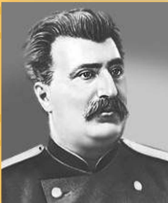
ПРЖЕВАЛЬСКИЙ НИКОЛАЙ МИХАЙЛОВИЧ

- руководитель экспедиции в Уссурийский край (1867-69гг), исследователь Центральной Азии (1870-1885), собрал ценные коллекции диких растений и животных.