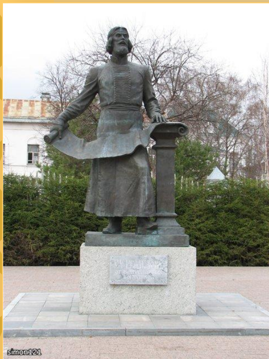
РЕМЕЗОВ СЕМЕН УЛЬЯНОВИЧ