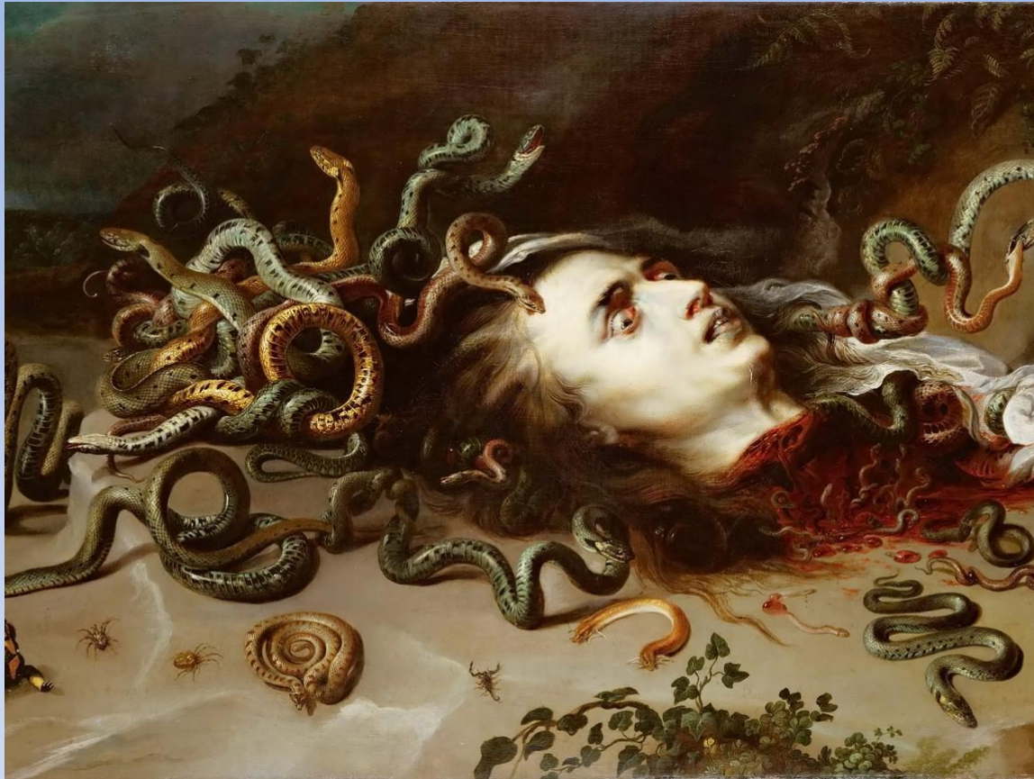
Голова Медузы - Рубенс. 1618. Холст, масло

Изобразив голову мифической Медузы Горгоны, Рубенс добился желаемого – напугал, шокировал, «поразил» своих современников, и нужно признать, сделал это мастерски. Но замысел художника был не так прост, как может показаться.