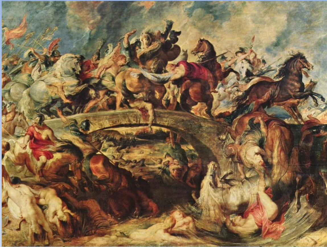
Рубенс. 1618. Дерево, масло. 121x215; 165,5 см