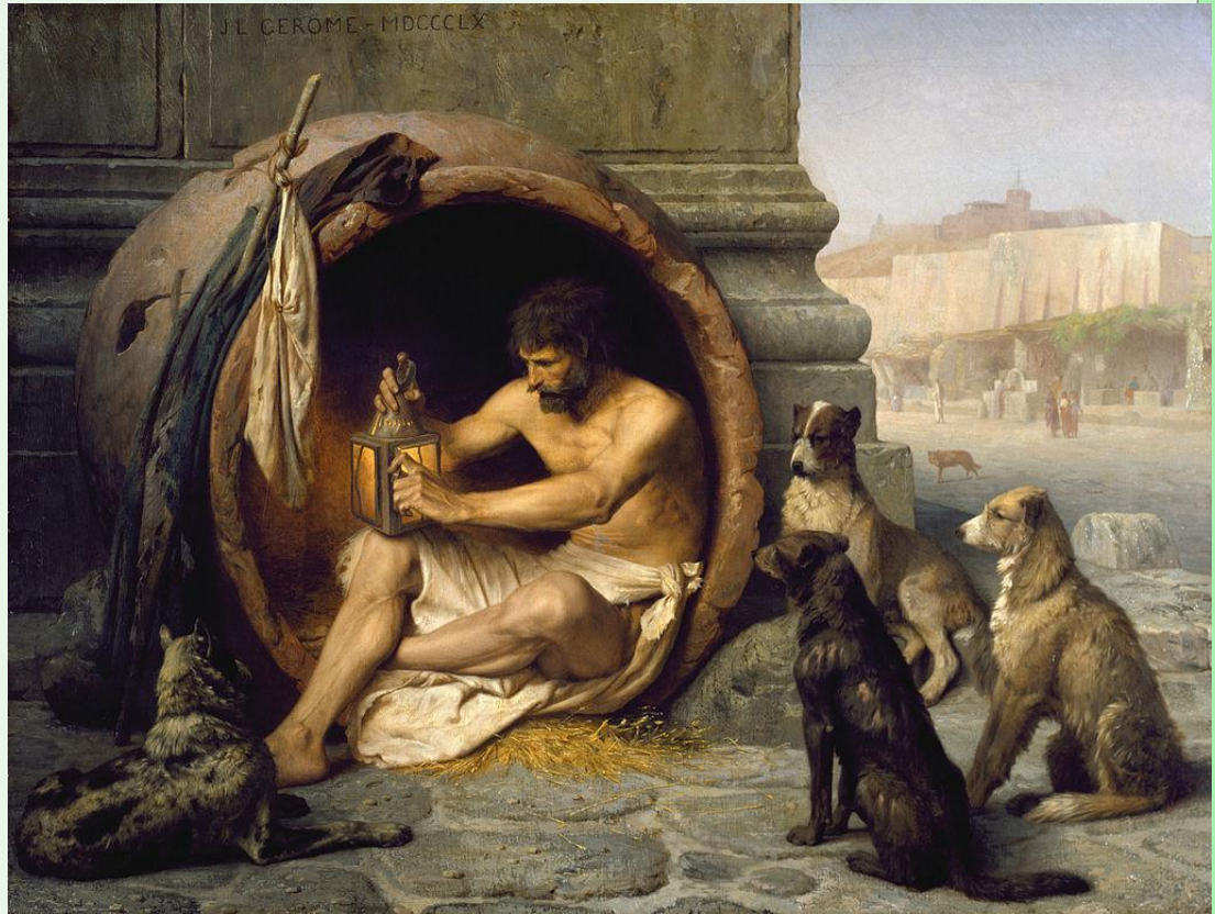
Жан-Леон Жером. Диоген

«Нужно не убегать от вещей, а учиться владеть ИМИ».