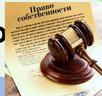
Доля преступлений против собственности, зарегистрированных в России