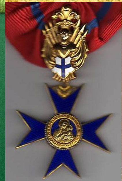
Орден святой Марии