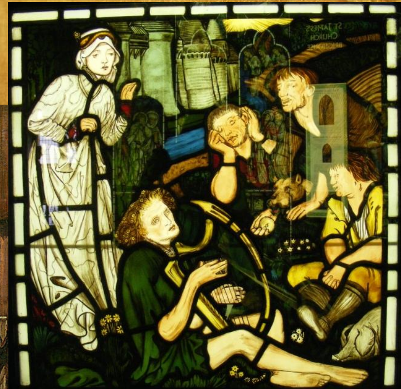
How Sir Tristram fled into the wild woods and there lost his wit because he might not see a lady how a lady caught him his harp whereon he played to the herosmen who mocked him yet while they brought him victual