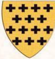
Sir Tor le Fise Arles