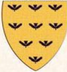
Sir Griflet le Fise de Dieu