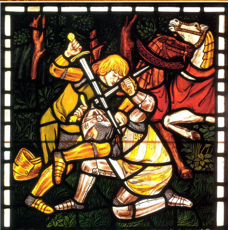
How Sir Tristram fought with Sir Marhaus the King's son of Ireland for the tribute of Cornwall and how Sir Tristram wounded him sore of which wound Sir Marhaus died