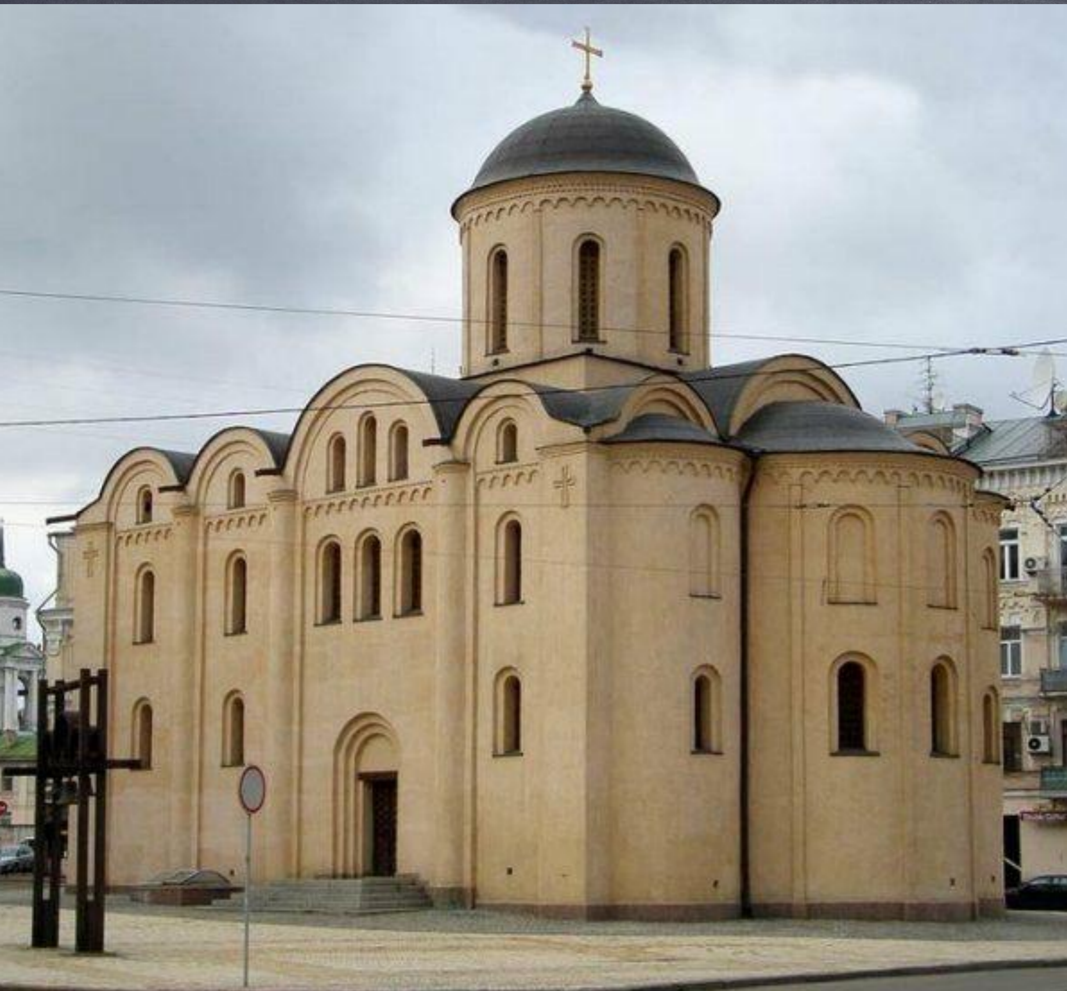
Десятинная церковь. 996 г.