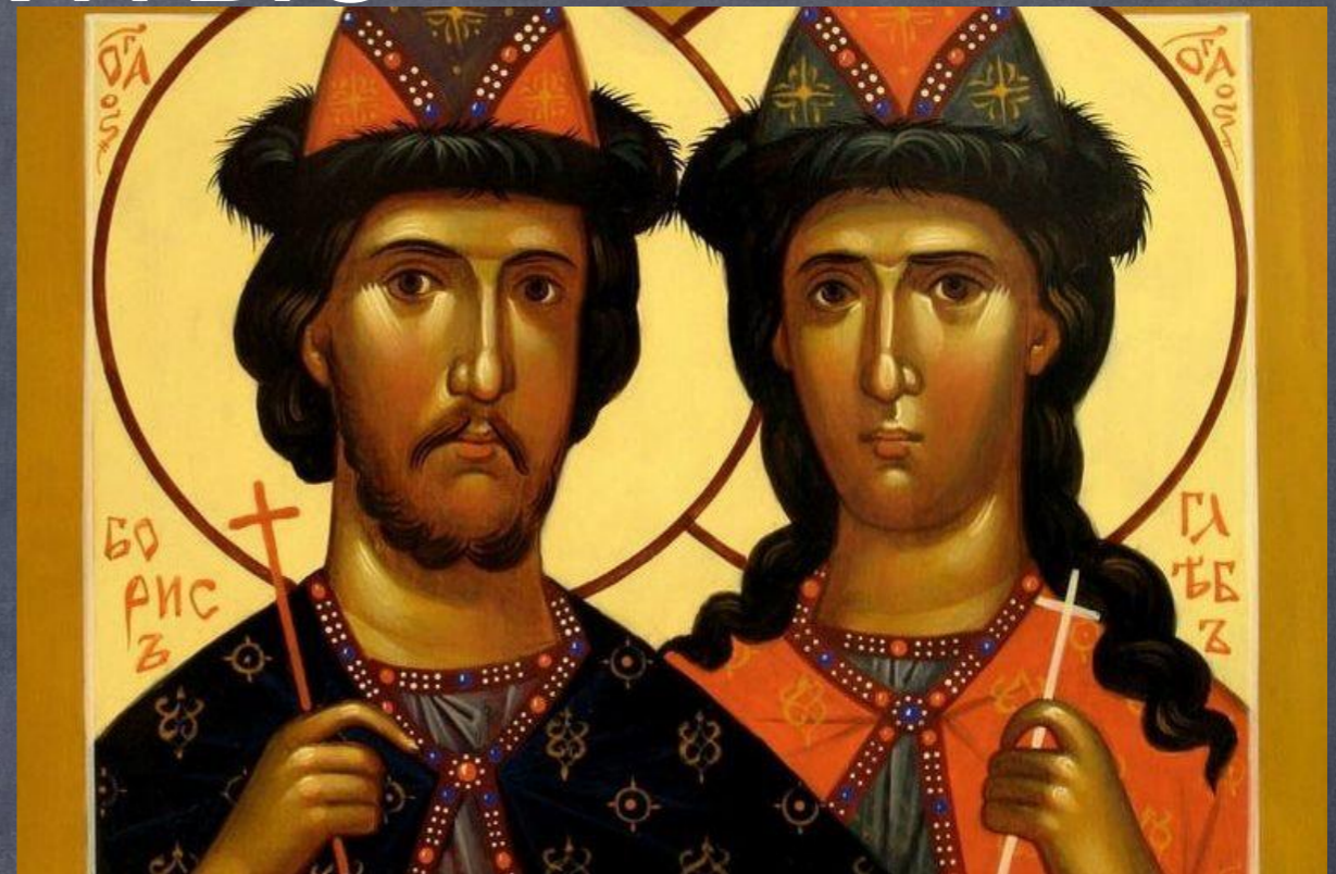
• Первые святые – Борис и Глеб