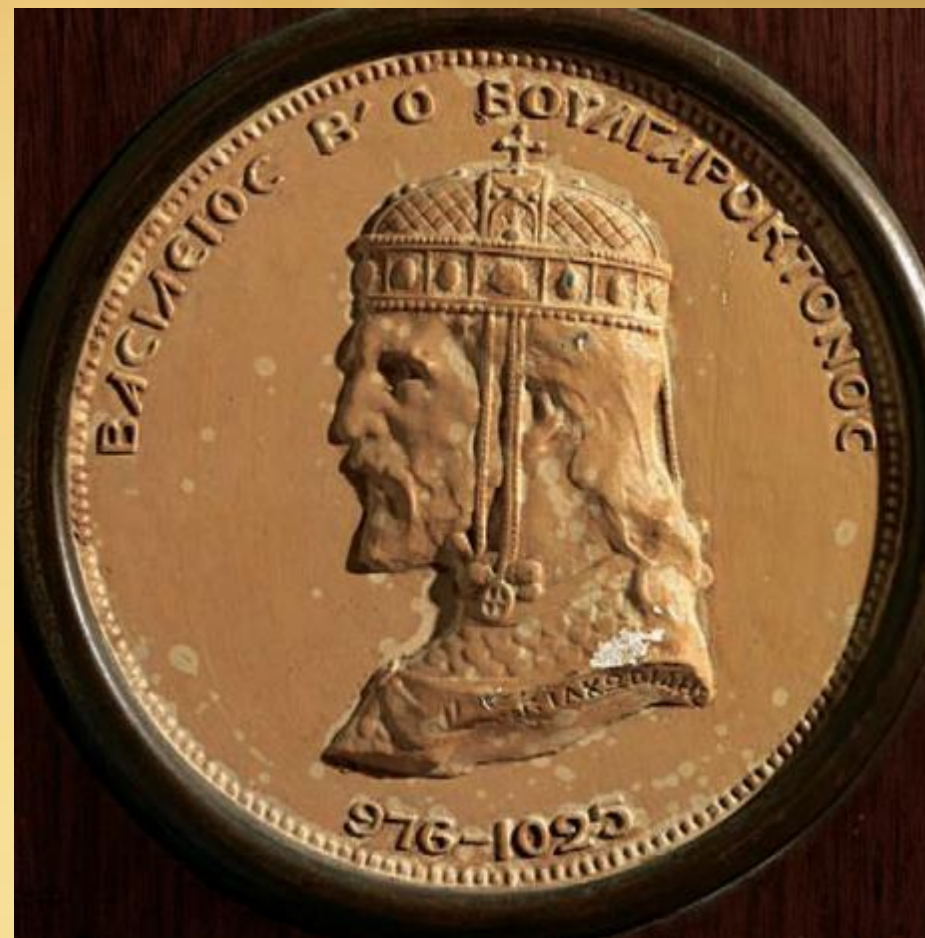
Василий II Болгаробойца. Современная памятная монета

Василий II Болгаробойца – византийский император, завоевал Болгарию