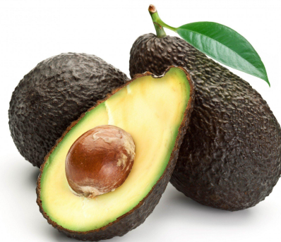
авокадо – в Америке