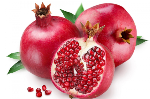
гранат – в Абхазии