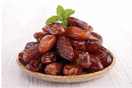
финики – в Иране, Египте, Алжире

Экзотические плодовые деревья в основном растут там, где всегда жарко :