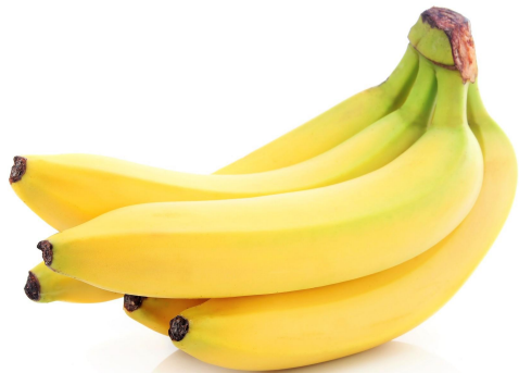
бананы – в Эквадоре