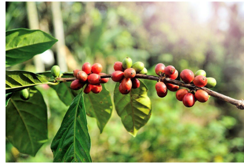
кофейное дерево – в Бразилии